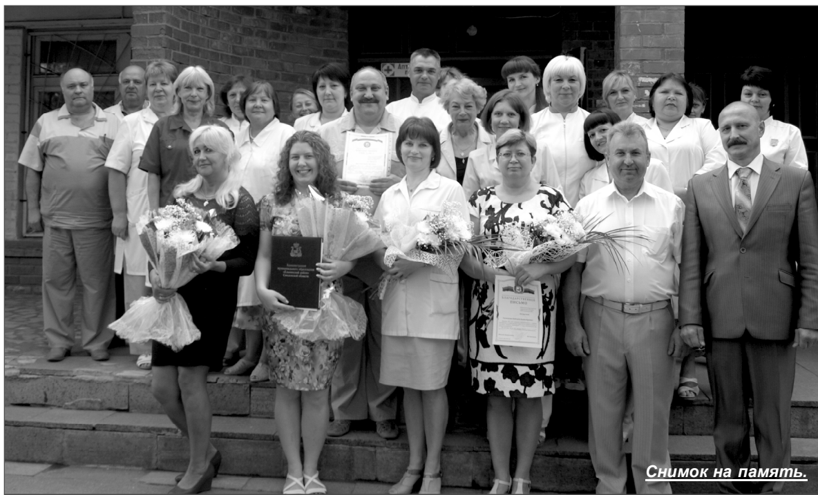
Снимок на память.

В канун своего профессионального праздника коллектив Центральной районной больницы собрался на пятом этаже в уютной ординаторской, чтобы в тёплой обстановке чествовать лучших из лучших. Перед началом собрания царил непринуждённый настрой, то и дело раздавались смех и шутки. Тон здесь задавали врачистоматологи. Что ж, ничего удивительного: данная медицинская специальность требует бо-