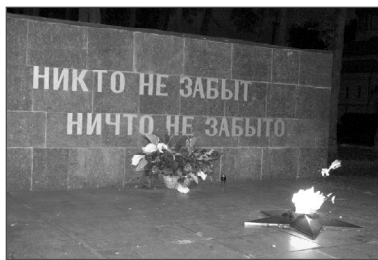
22 июня в сквере Боевой Славы состоялся митинг, посвященный Дню памяти и скорби.

Этот день собрал не только тех, кто пережил кровопролитную войну сороковых годов, но и нынешнее поколение, которое свято чтит память о тех, кто