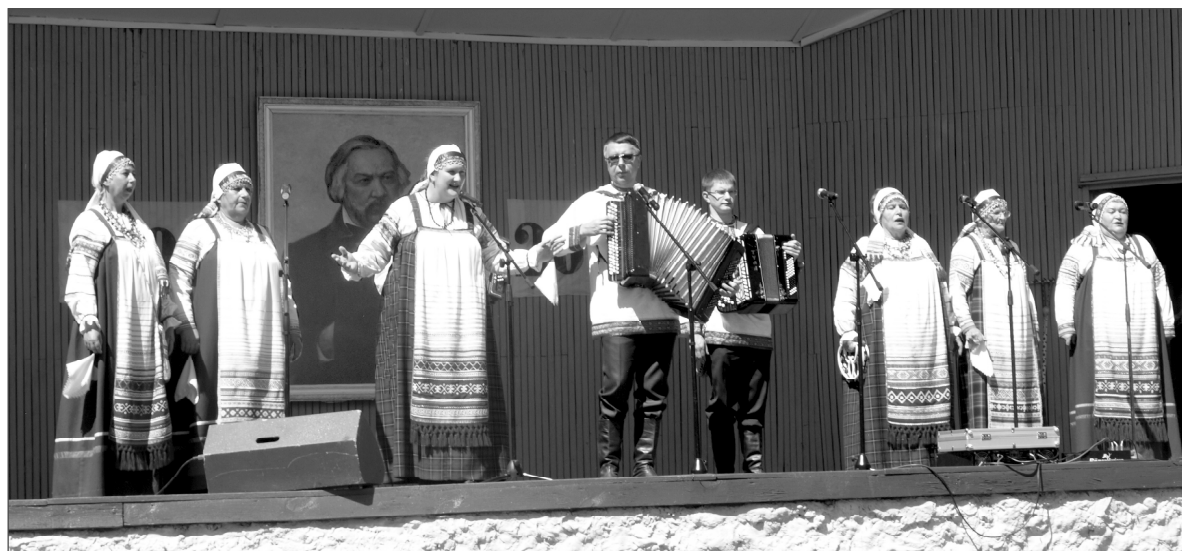
Выступает ансамбль «Березняночка» из Рудни.

Закрытие 58-го международного музыкального фестиваля имени М.И.Глинки состоялось в первое воскресенье июня в Музее-усадьбе великого композитора в Новоспасском.