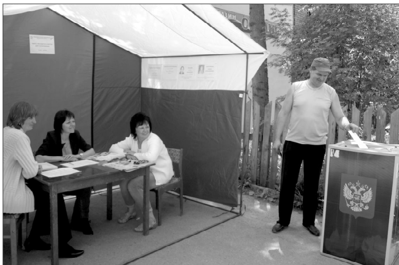
На одном из участков предварительного голосования.

жители всех избирательных округов получили возможность самим определить, кого из кандидатов от «Единой России» они хотят видеть на предстоящих выборах.