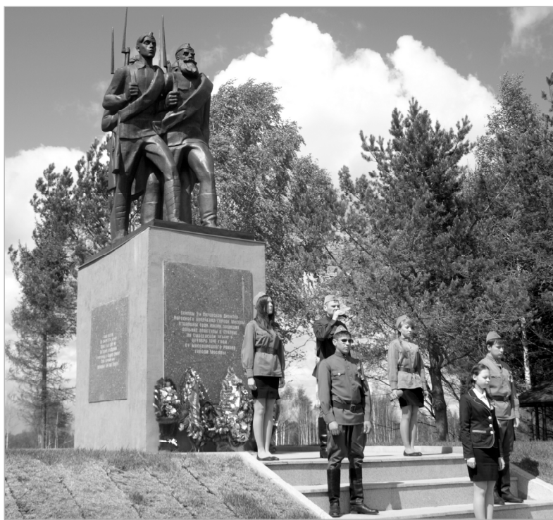
Ушедшие в бессмертие