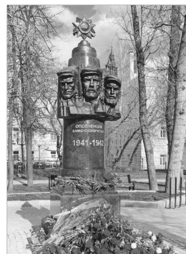
Памятник ополченцам в Москве.