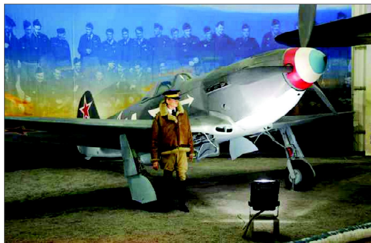
Истребитель «Як-3» полка «Нормандия-Неман» в авиационном музее в Ле Бурже.

ской земле: «Дьявольская страна, защищающаяся без посторонней помощи; правда, в неё легко входишь, а выйти – не выйдешь».