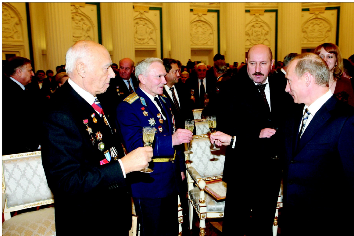
Москва. Кремль. Президент России В.В.Путин поздравляет ельнинскую делегацию с присвоением Ельне почётного звания «Город Воинской Славы». К поздравлениям присоединился народный артист СССР В.Этуш (слева).

Главный мировой лидер, Президент России В.В.Путин, не только много сил и внимания уделяет борьбе за мир во всём мире, но и помнит, с чего начинается Россия – с таких маленьких городов, как Ельня. Ведь именно в сельской провинции фашистские захватчики в годы Великой Отечественной вой-