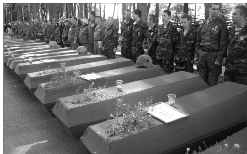
Ежегодно усилиями поисковиков встают из небытия сотни солдат, десятки – снова обретают имя.