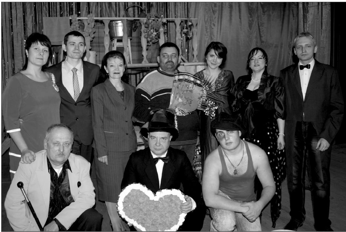
Хроника земли гвардейской