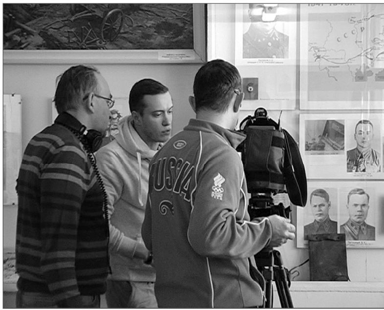
Наши гости в районном музее.

Первым каналом центрального телевидения к 70-летию Великой Победы готовится выпуск специального проекта под рабочим названием «Города Воинской Славы». В связи с этим, дирекция информационных программ Первого канала обратилась к руководству Ельнинского района за содействием в проведении съёмок на территории нашего муниципального образования и города Ельни.