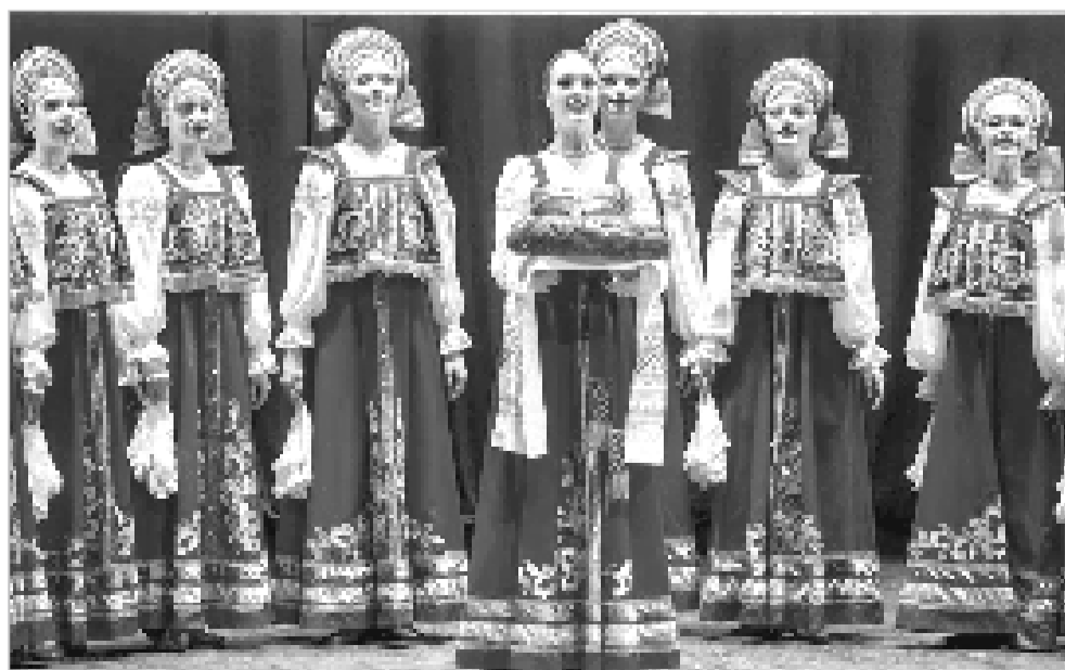
Форум «Малая Родина – большая ответственность» к Дню местного самоуправления.