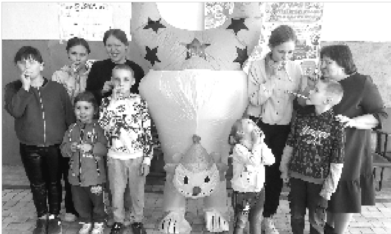
Звонкий смех делает нашу жизнь ярче и счастливее.