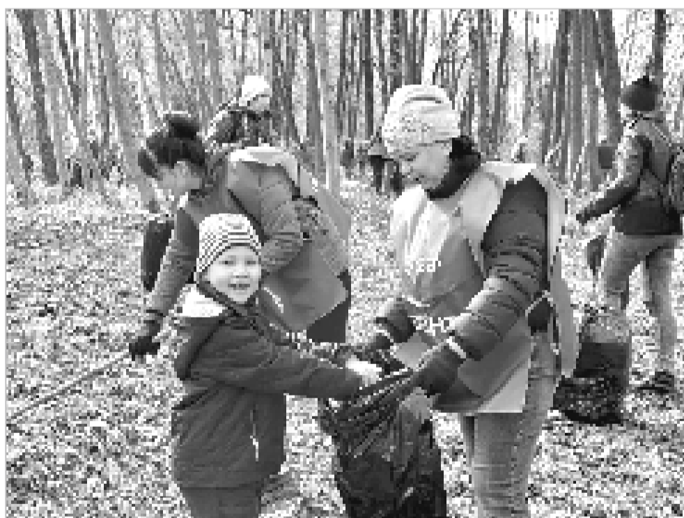
Сделаем родную землю чище.