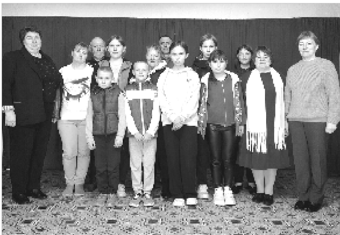
Многие тайны птичьего мира теперь понятны и детям, и взрослым.

художественный руководитель Лапинского СДК.