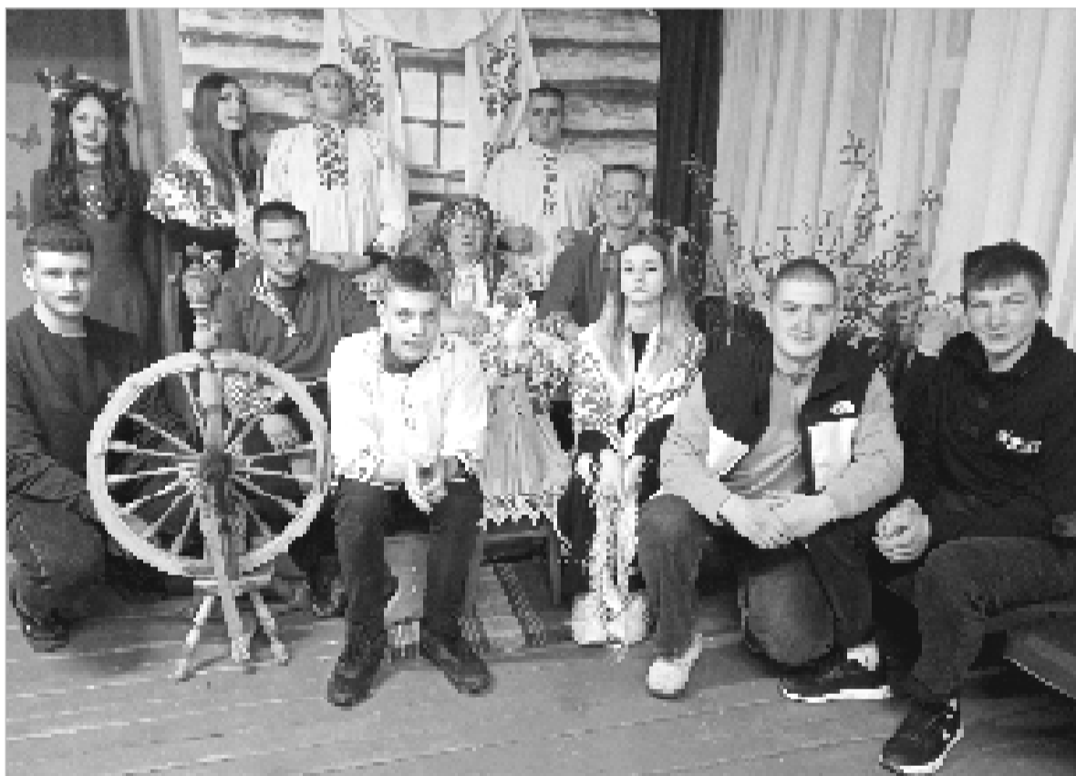
Весенние посиделки в Богородицком СДК.