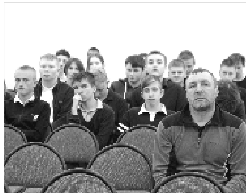
Будущие выпускники школ получили полезную информацию о многих профессиях.