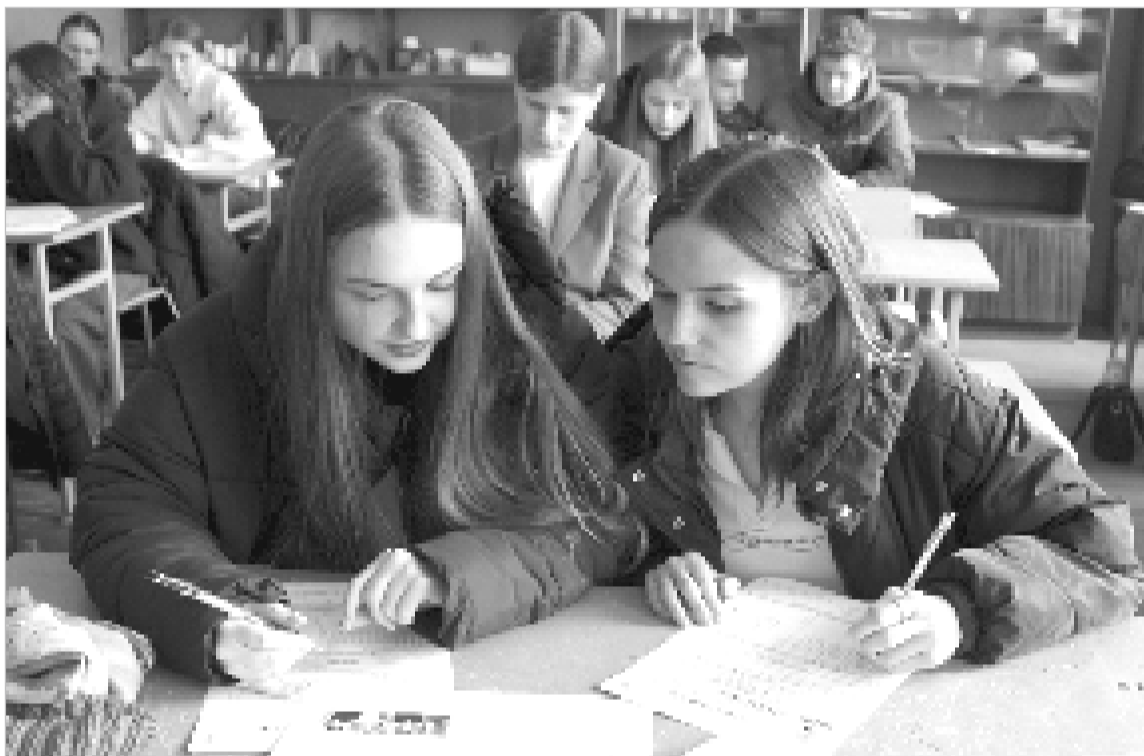
Участники «Диктанта Победы» проверили свои знания и ещё раз вспомнили важные страницы нашей истории.

В городе Воинской Славы Ельня 24 апреля состоялась Всероссийская историческая акция «Диктант Победы».