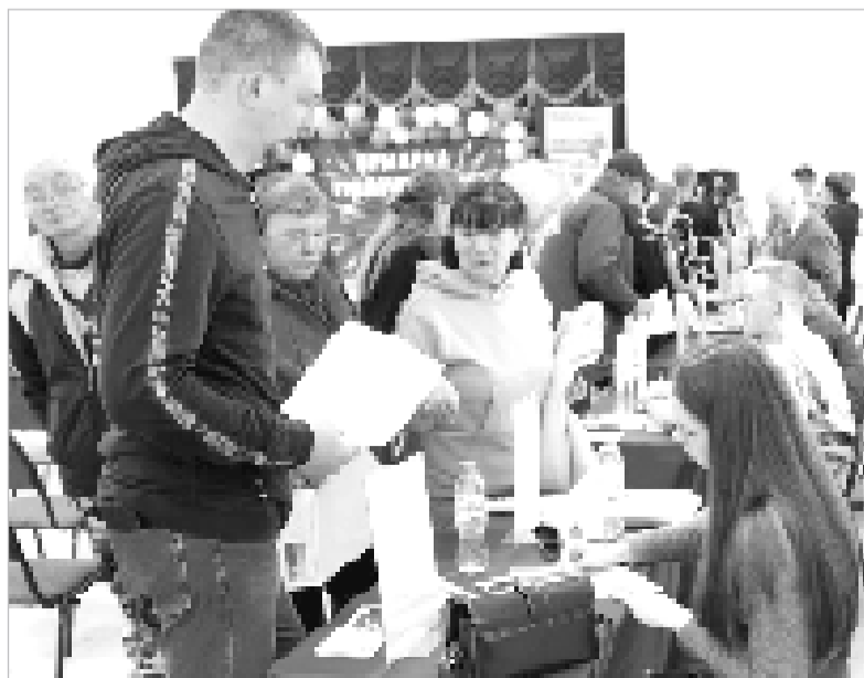
Соискатели смогли узнать подробности предлагаемых условий трудоустройства непосредственно у работодателей.

шеклассники школ города, а также представители здравоохранения, МФЦ, правоохранительных органов, социальной сферы.