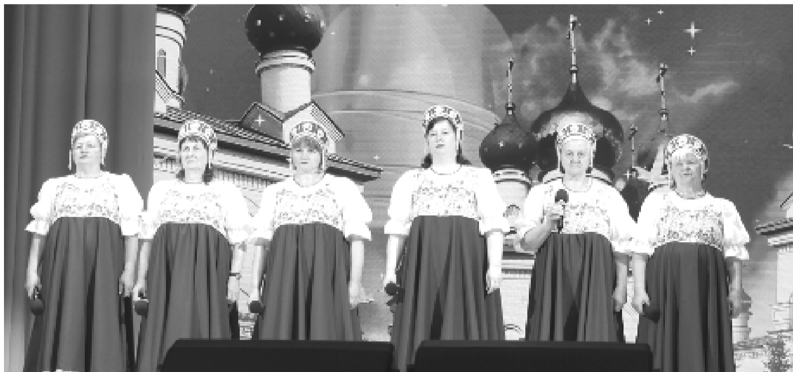
Заслуженной наградой талантливым павловским артистам стали бурные аплодисменты.