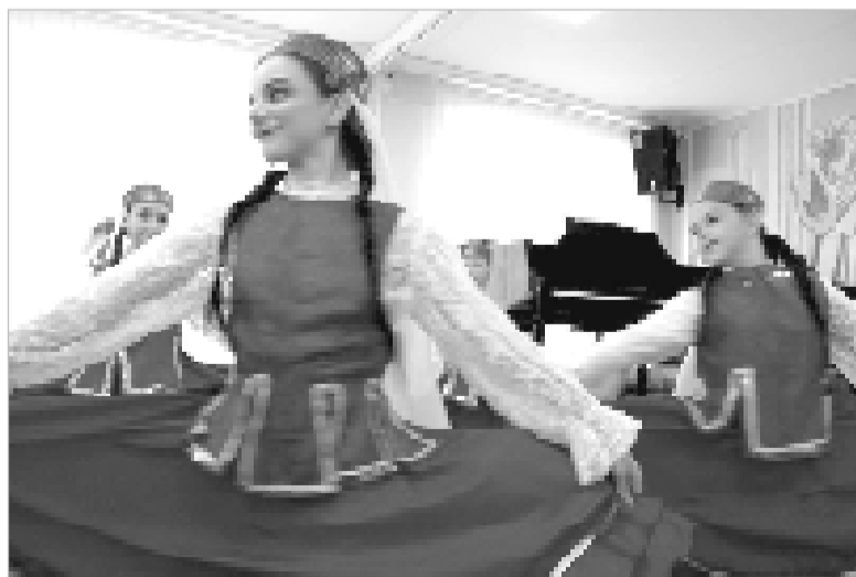
Народный татарский танец в исполнении юных дорогобужан.

Прекрасным подарком детям и взрослым стали народные татар-