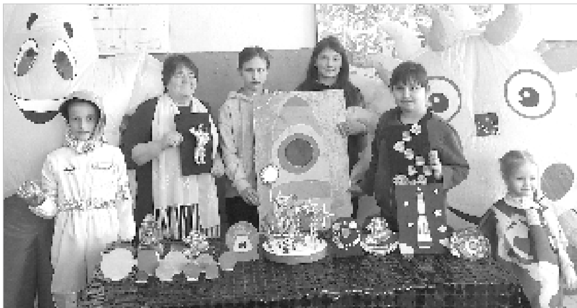
Выставка поделок «Звёздам навстречу» в Лапинском СДК.