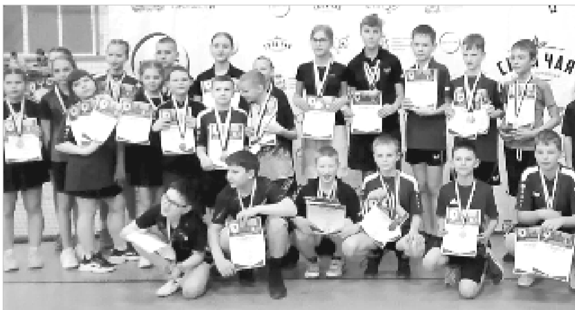
Первенство Смоленской области по настольному теннису: фото на память.

Команда теннисистов Ельнинского Центра творчества 29 марта приняла участие в первенстве Смоленской области по настольному теннису.