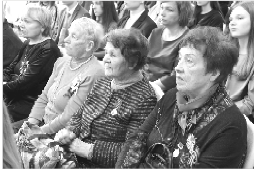
Бывшие малолетние узники фашистских концлагерей до сих пор не могут забыть зверства, творимых нацистами.

«Массовый угон людей с территории нашей области начался в 1943 году. Нас, как скот, погрузили в товарные вагоны и повезли в Германию без еды, воды, в антисанитарных условиях. Наше детство отобрала война. Она уничтожила его. Наше детство прошло в холодных бараках за колючей проволокой, под лай собак и под дулом автоматов. Фашистами было создано 14 тысяч концлагерей, через которые прошли 18 миллионов человек. Из них 11 миллионов человек погибло, в том числе 6 миллионов несовершеннолетних детей. Из 10 детей долой вернулся только один. Кто мы? Мы жертвы нацизма и фашизма. Сегодня на Смоленщине осталось 1312 малолетних