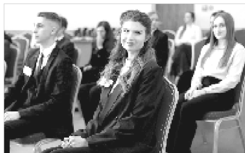
Региональная олимпиада «Умники и умницы» собрала талантливую и энергичную молодёжь.