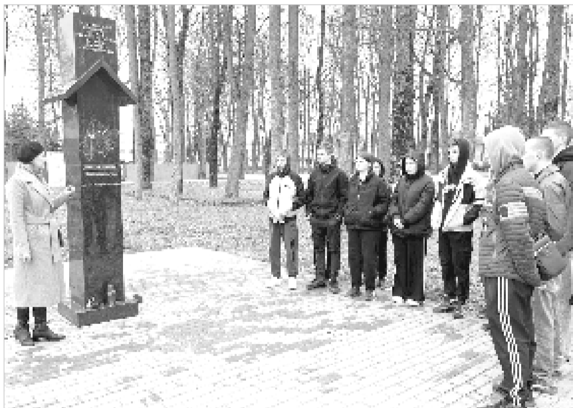
На Ельнинской земле рана, нанесённая преступлениями нацистского режима в период оккупации, до сих пор кровоточит.

День памяти жертв геноцида советского народа, совершённого нацистами и их пособниками в период Великой Отечественной войны 1941 – 1945 годов, впервые отметили в России 19 апреля. Памятная дата установлена Указом Президента Российской Федерации Владимира Владимировича Путина от 29 декабря 2025 года и приурочена к изданию 19 апреля 1943 года Указа Президиума Верховного Совета СССР № 39 «О мерах наказания для немецко-фашистских злодеев, виновных в убийствах и истязаниях советского гражданского населения и пленных красноармейцев, для шпионов, изменников родины из числа советских граждан и для их пособников». В нём были впервые зафиксированы свидетельства системной и целенаправленной политики нацистов по уничтожению мирных жителей Советского Союза.