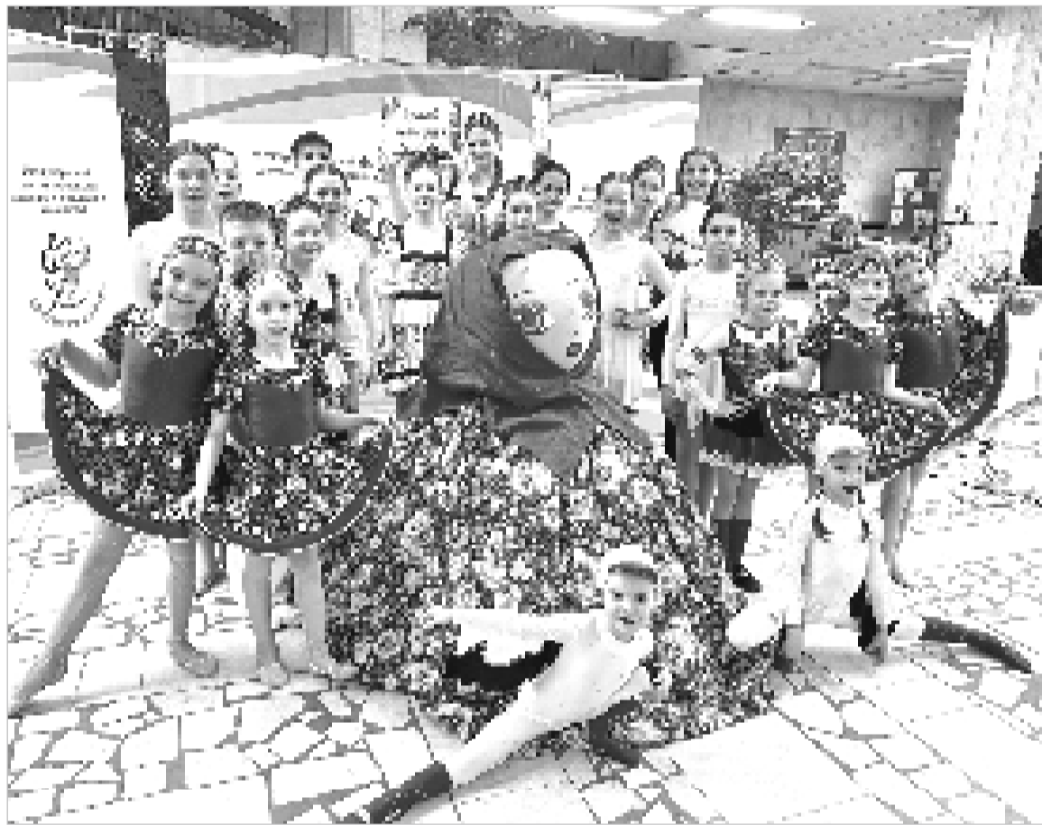
Юные гимнасты цирковой студии «Фламинго» покорили «Весеннюю капель» в Ульяновске.