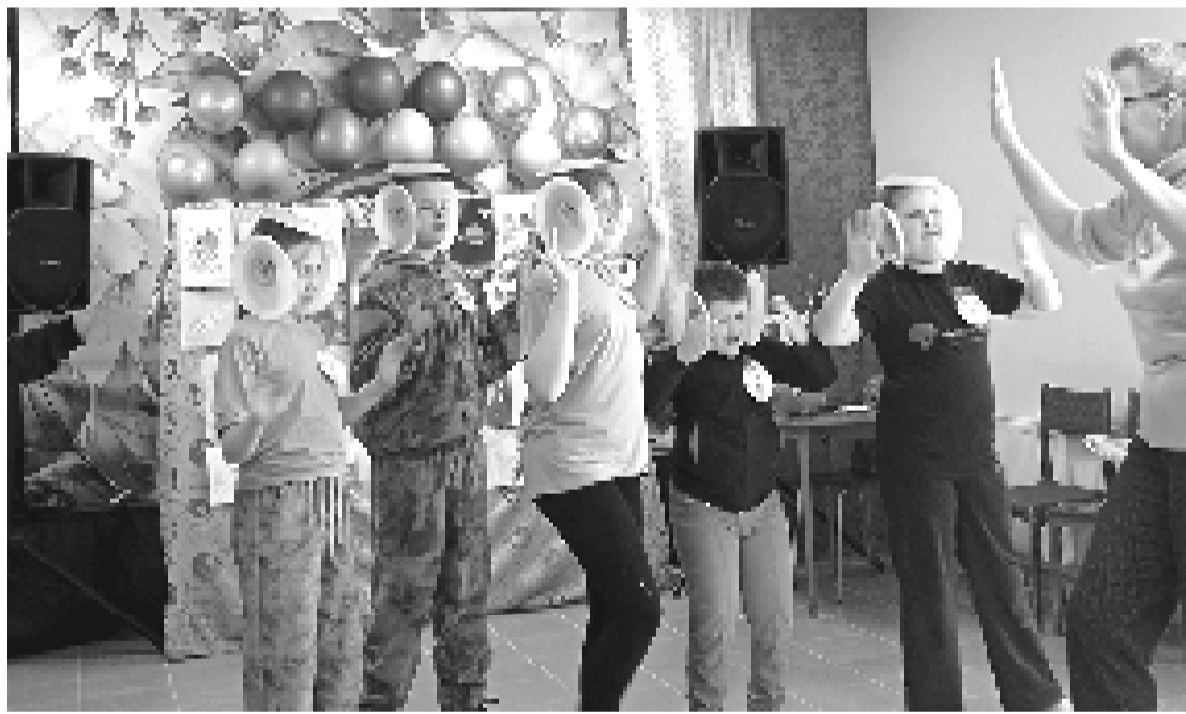
Неделя космоса в Пронинском СДК.