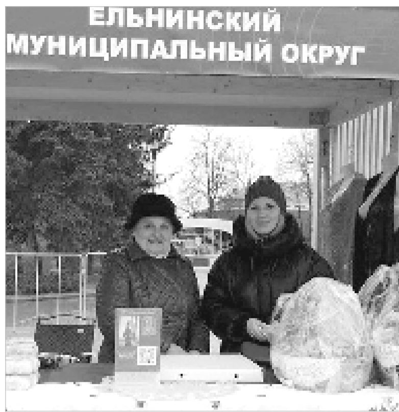
Делегация Ельнинского округа на родине первого космонавта планеты.

Кульминацией праздника стал торжественный митинг в память о нашем знаменитом земляке.