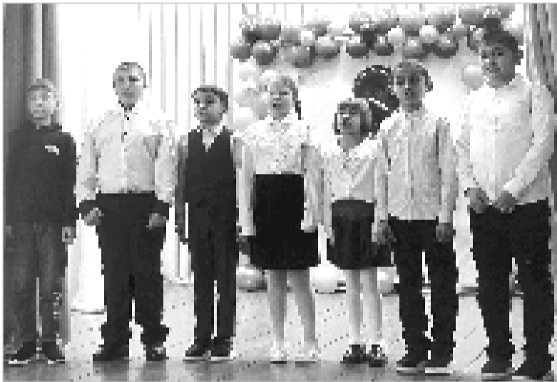
В подарок любимым мамам.