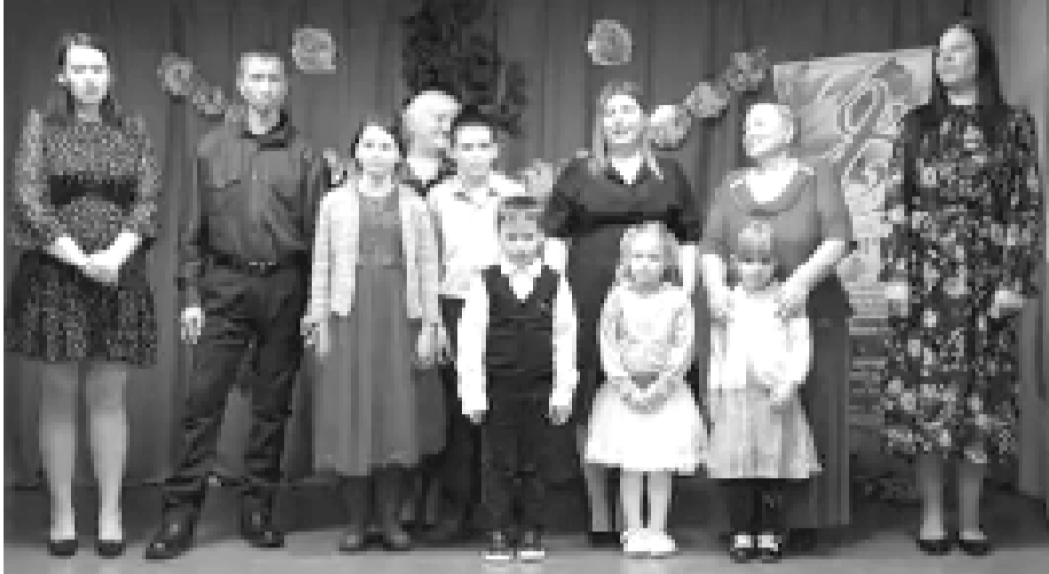
Яркая и увлекательная программа порадовала уваровцев.

В зале библиотекарем была подготовлена книжная выставка. Работники Уваровского СДК и библиотеки.