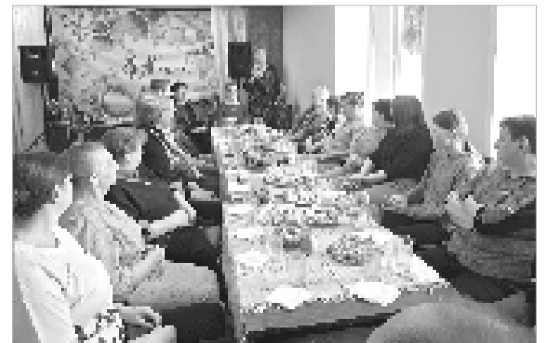
За гостеприимно накрытым столом места хватило всем.

Спасибо всем участникам и гостям за эту незабываемую встречу! Работники Пронинского СДК.