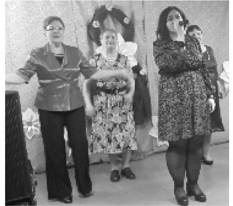
Концерт в Коробецком СДК прошёл в атмосфере весеннего настроения и тепла.