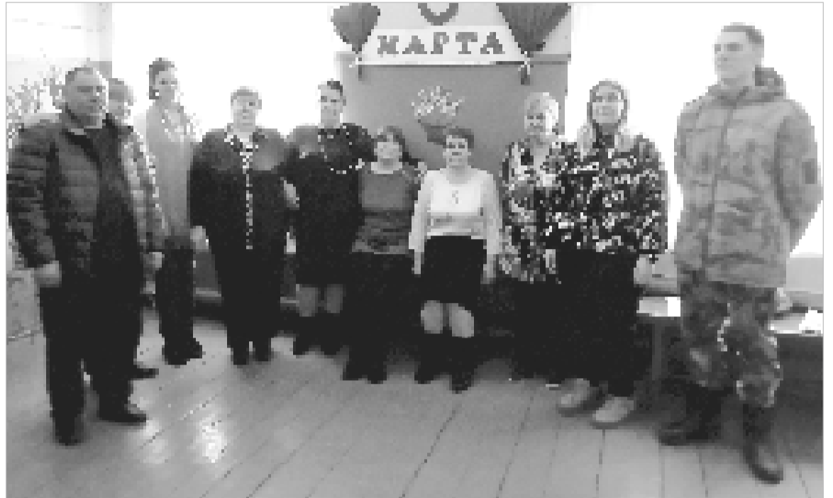
Слова благодарности и поздравлений звучали в адрес всех женщин в Мазовском СДК.