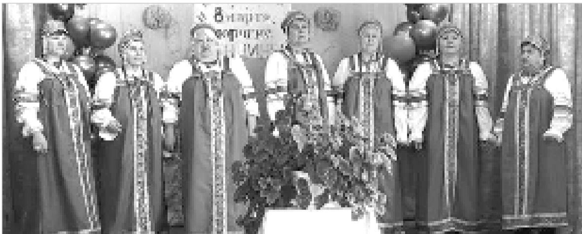
Прекрасное настроение подарили зрителям участницы вокальной группы «Селяночка».