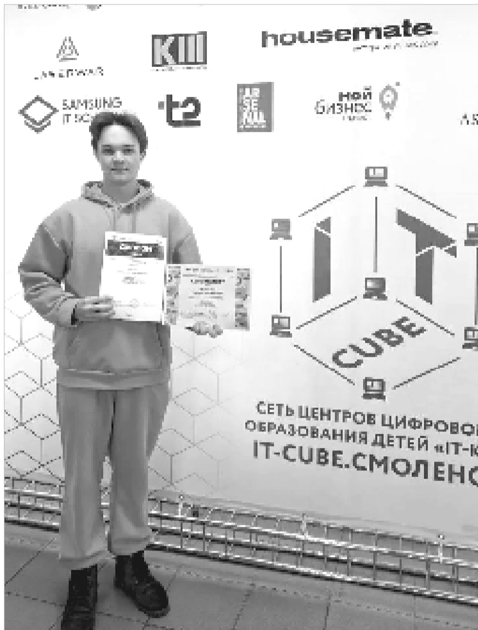
А. Лесничий продемонстрировал отличные навыки в области программных разработок.