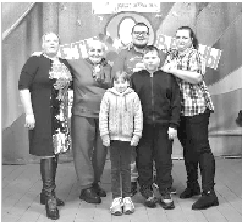
«Цветы весны» прекрасным дамам.