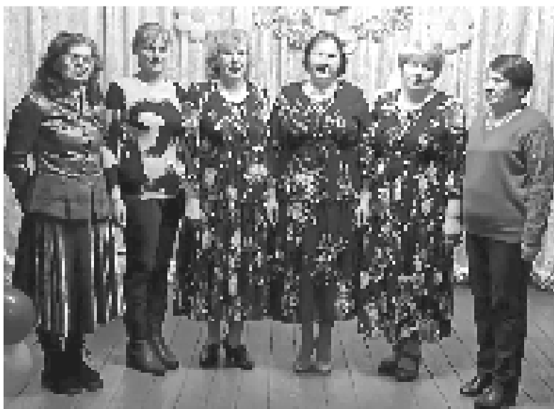
Бурными аплодисментами встречали высококовцы давно полюбившихся артистов.

В Высоковском сельском Доме культуры состоялся праздничный концерт «С любовью к женщине».