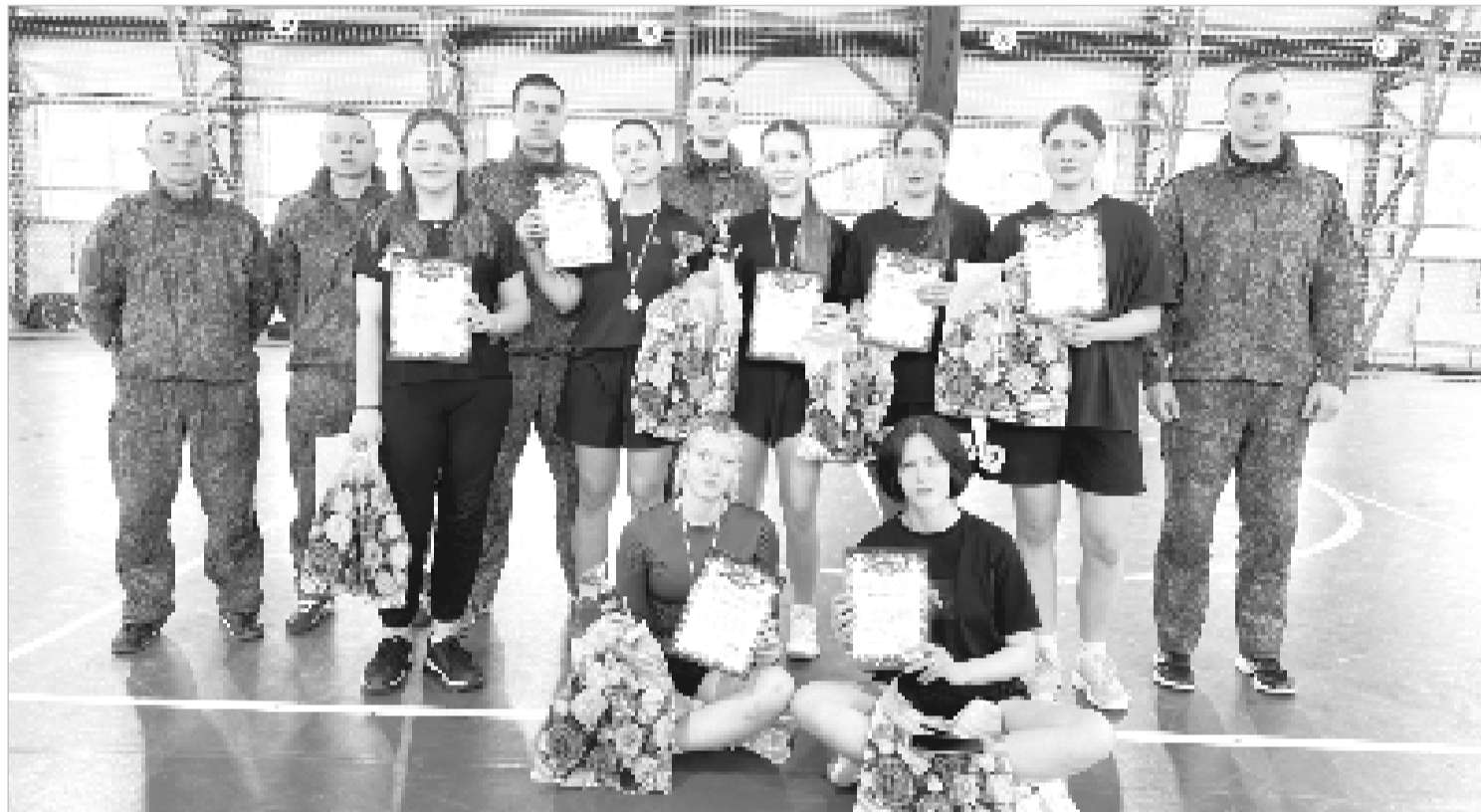
Наши девушки – решительные, отважные, амбициозные.