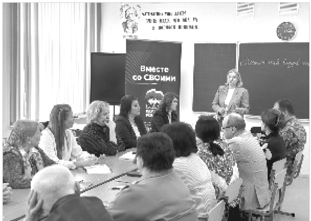
О расширении мер поддержки ветеранов СВО поговорили на профильной площадке.