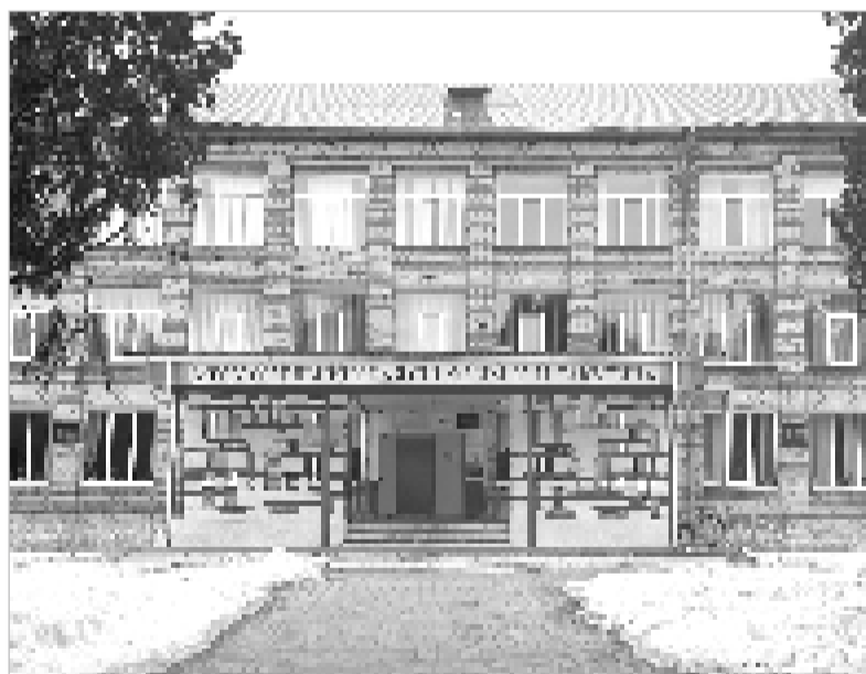
Школа №2 им. К.И. Ракутина после капремонта.