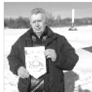
Лапинцы выразили солидарность с крымчанами.

Работниками Лапинского сельского Дома культуры совместно с жителями и гостями деревни Лапино был организован тематический флэшмоб.