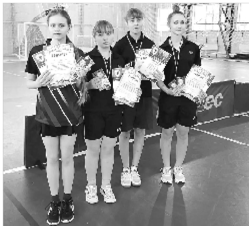
Нашим теннисисткам нет равных в области.