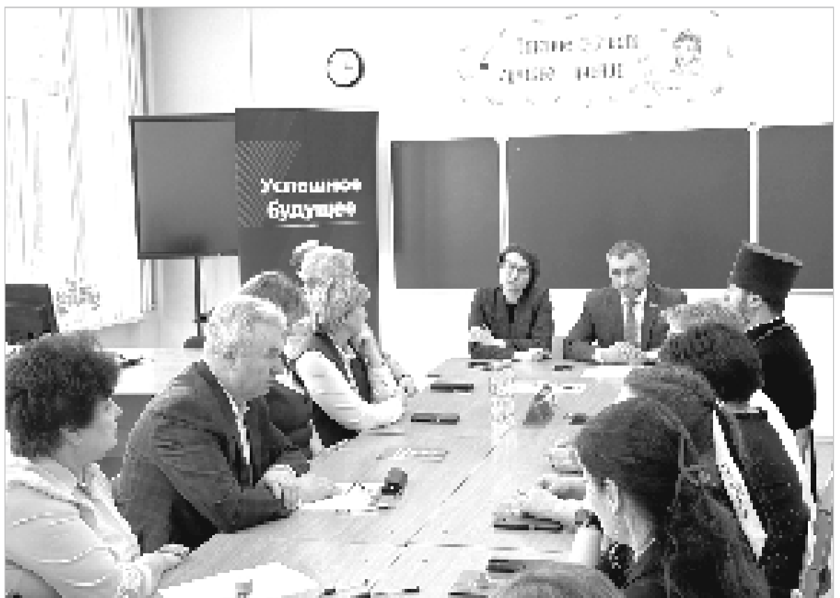
Целевое обучение, как метод привлечения молодых специалистов в школы округа, обсудили директора школ и представители региона.