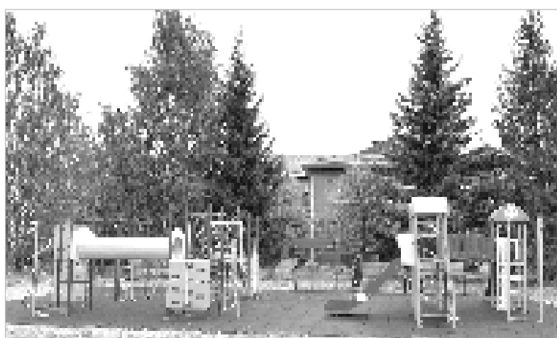
Новая детская площадка в мкр. Кузузовском.