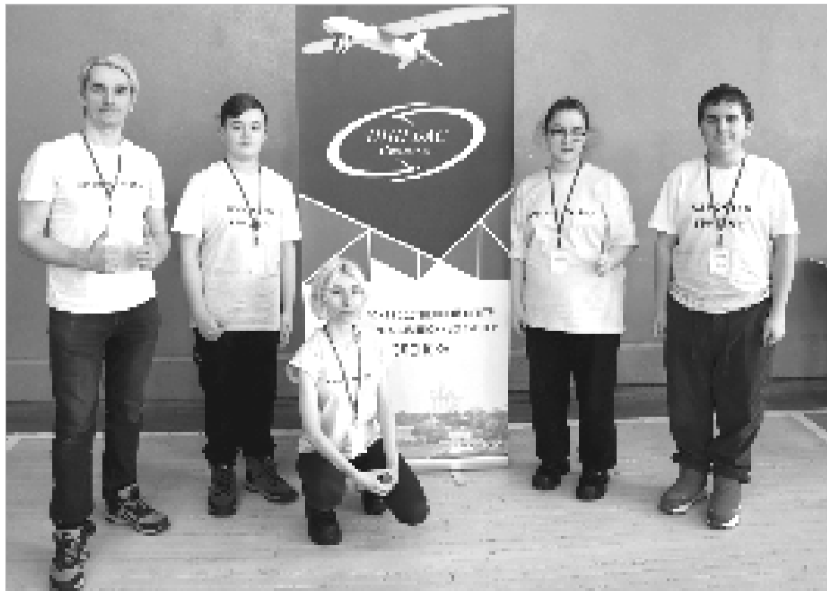
Ельнинские «Гвардейцы» покорили «Кибердром».

Финал образовательного трека «Кибердром.Старт» всероссийского конкурса «Кибердром» состоялся 14 февраля в школе №33 города Смоленска. Соревнования направлены на знакомство учащихся с миром беспилотных технологий, авиации и программирования. Такие мероприятия способствуют популяризации науки и высоких технологий среди молодёжи и формируют кадровый потенциал для развития беспилотной отрасли региона.