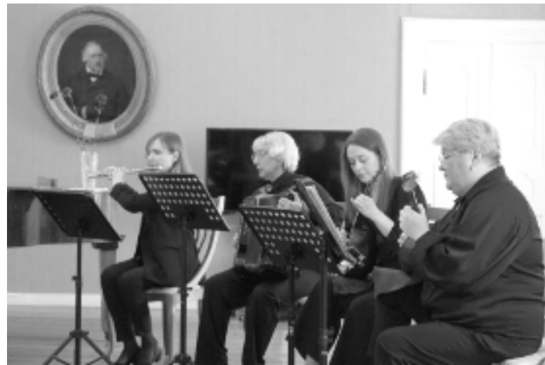
Музыка Михаила Глинки звучит в каждом сердце.