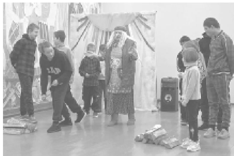
Подвижные игры и забавы для фенинской детворы.

Кульминацией праздника стало сжигание чучела Масленицы. Большое, ярко украшенное чучело, начиненное сеном, было установлено на специально подготовлен-