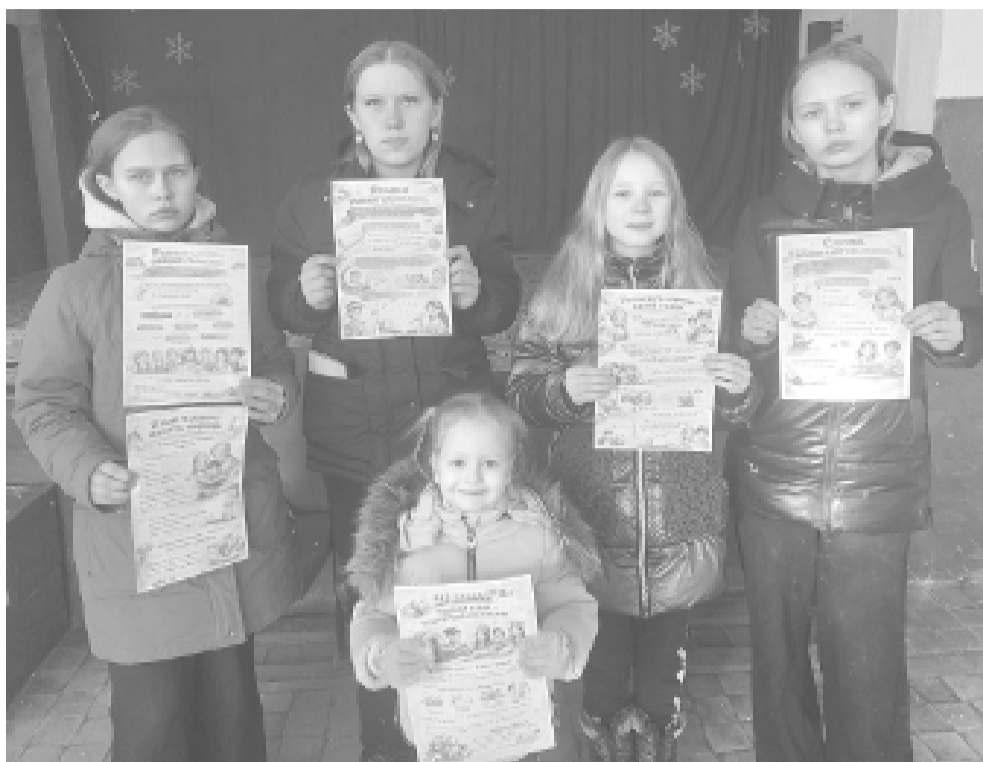
Родной язык – бесценный дар и символ принадлежности к единой русской культуре.

В Лапинском сельском Доме культуры 21 февраля состоялось мероприятие «Родной язык – наш первый помощник». Оно напомнило каждому о бесценном даре – родном языке, который сопровождает нас с первых мгновений жизни и помогает находить общий язык с миром.