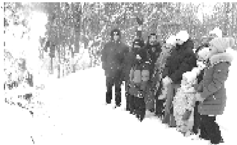
Проводы русской зимы в д. Теренино.

Под таким названием работники Теренинского сельского Дома культуры и библиотеки провели мероприятие, посвящённое проводам зимы.