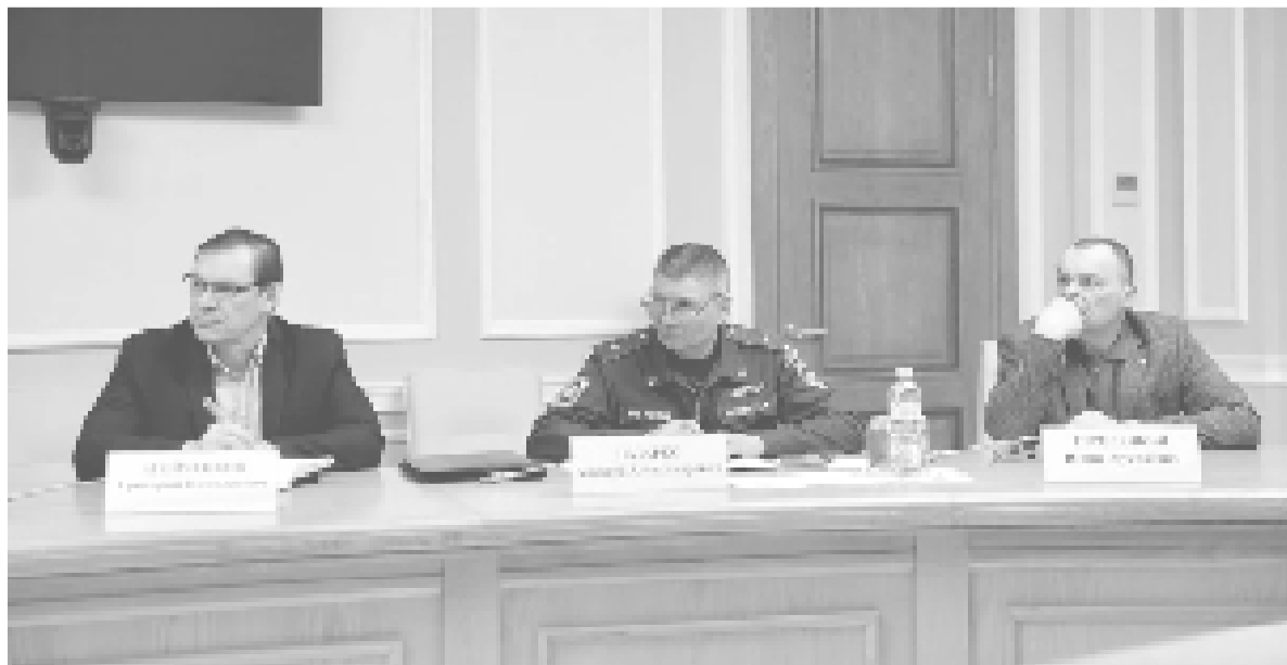
Недопущение чрезвычайной ситуации в связи с весенним паводком – одна из главных задач руководства региона.