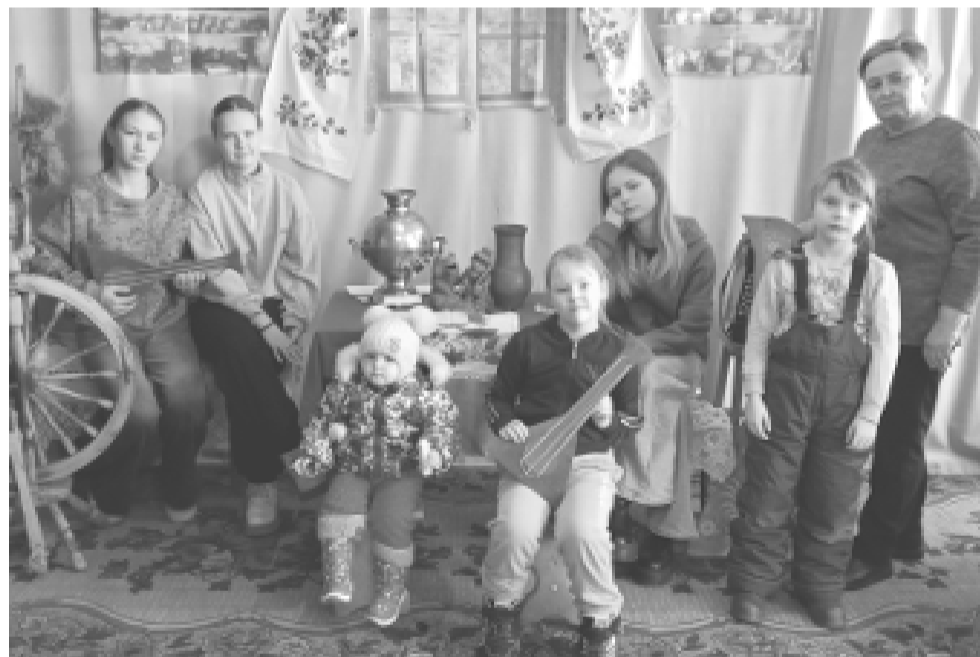
«Лаптев день» напомнил детям о богатом культурном наследии предков.

В минувшие выходные Богородицкий сельский Дом культуры наполнился звонким смехом, задорными песнями и духом старинных традиций. Здесь состоялся необыкновенный праздник – «Лаптев день»!