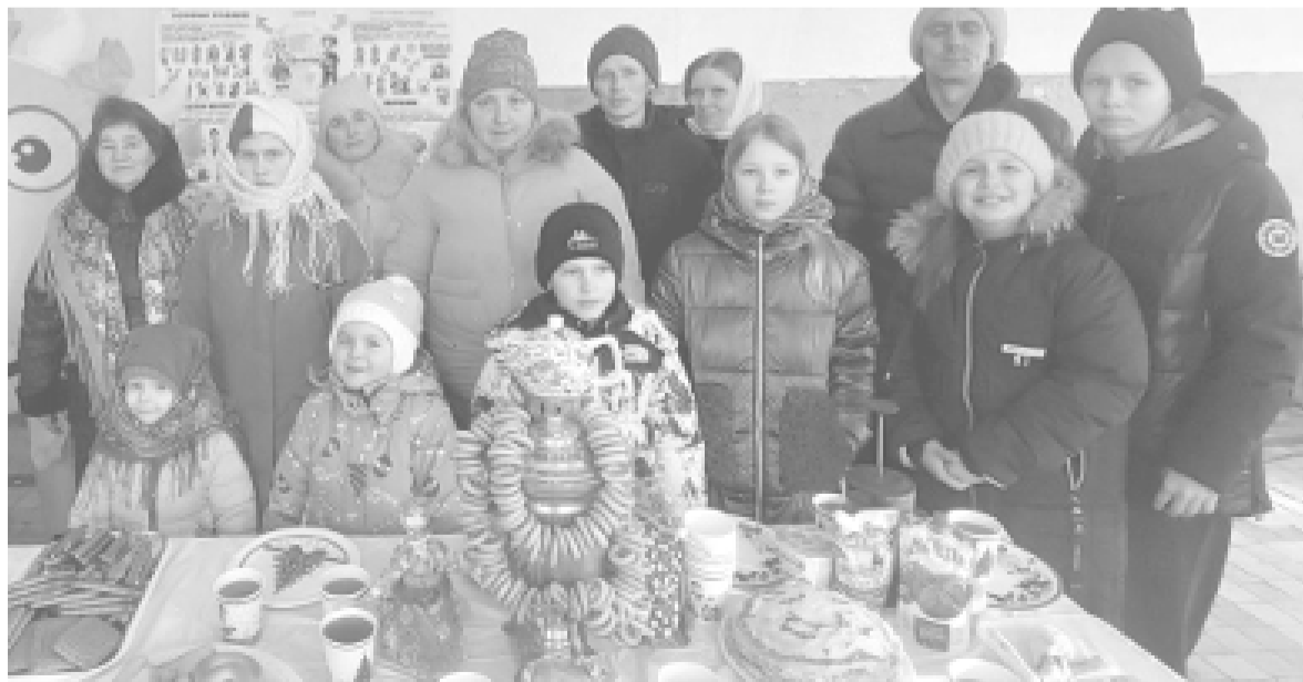
В Лапинском СДК было весело и взрослым, и детям.

лики и, конечно же, румяные, ароматные блины с самыми разными начинками — сытные с мясом, нежные с творогом, а также классические, к которым каждый