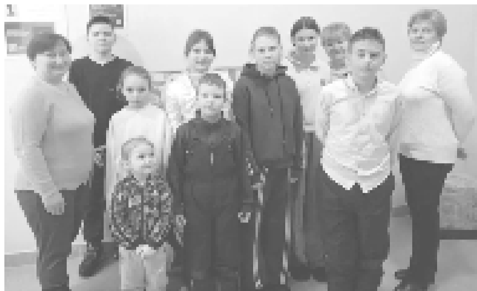
Родной язык – средство познания и ключ к сохранению мира.

Родной язык – это целый мир, живая память народа, его душа, его достояние.