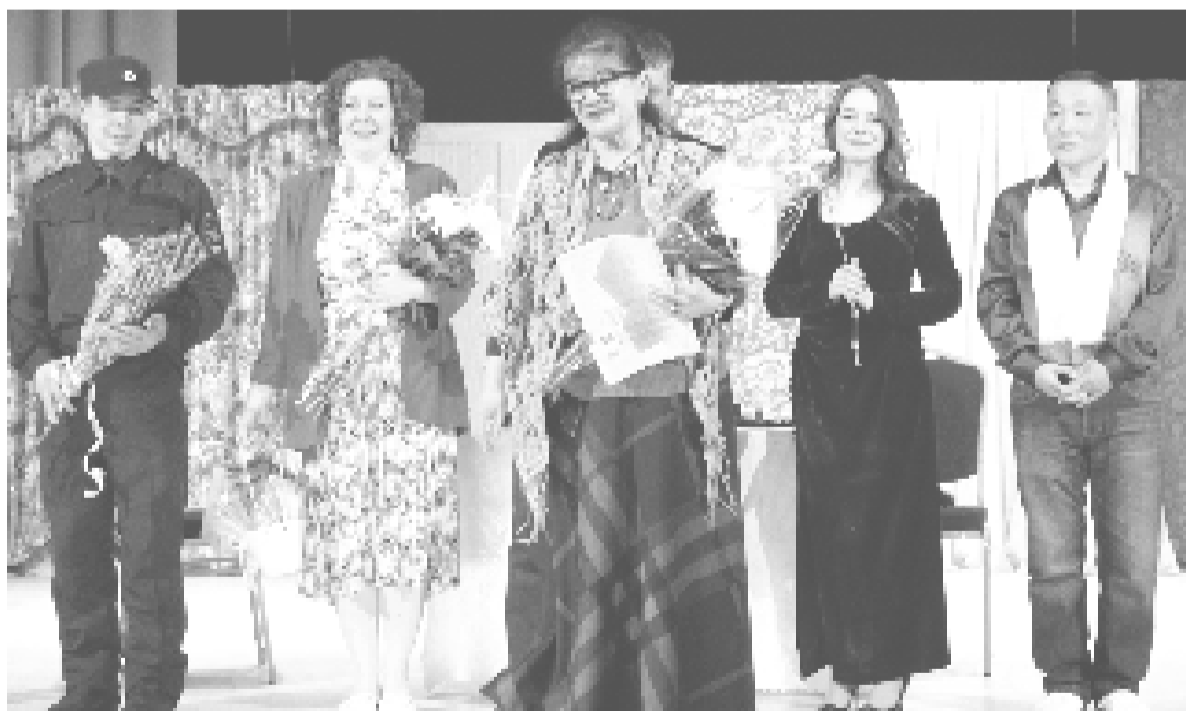
Наши талантливые артисты подарили ельнинским театралам минуты радости и наслаждения.