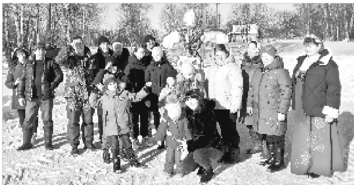
Павловцы от мала до велика собрались на весёлые масленичные посиделки.