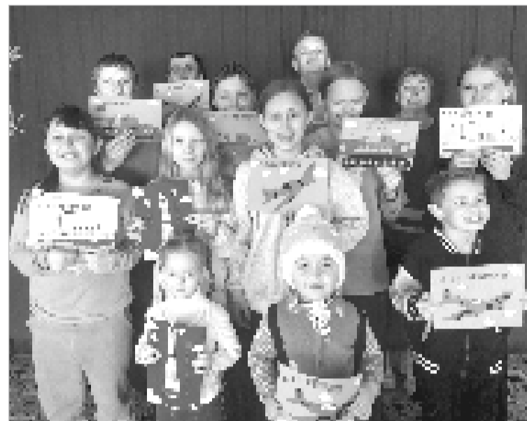
Лучший подарок тот, что сделан своими руками.

В Лапинском сельском Доме культуры состоялось мероприятие «Отвага, Родина и честь», посвященное Дню защитника Отечества.