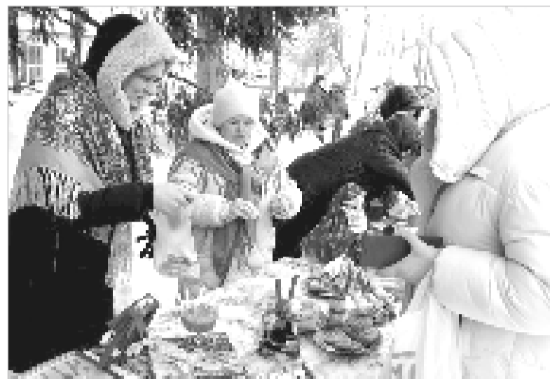
Ароматные блинчики с горячим чаем – символ Масленицы и народных традиций.

Весёлый праздник «Зиму провожаем, весну встречаем» состоялся 22 февраля на площади перед районным Домом культуры.