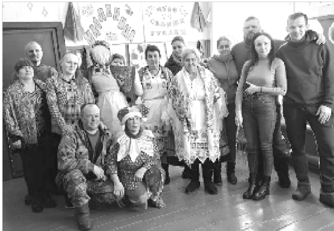
Масленичные гуляния объединяют земляков.

Затем последовало угощение румяными блинчиками и горячим чаем из самовара. Сотрудники Мазовского СДК.