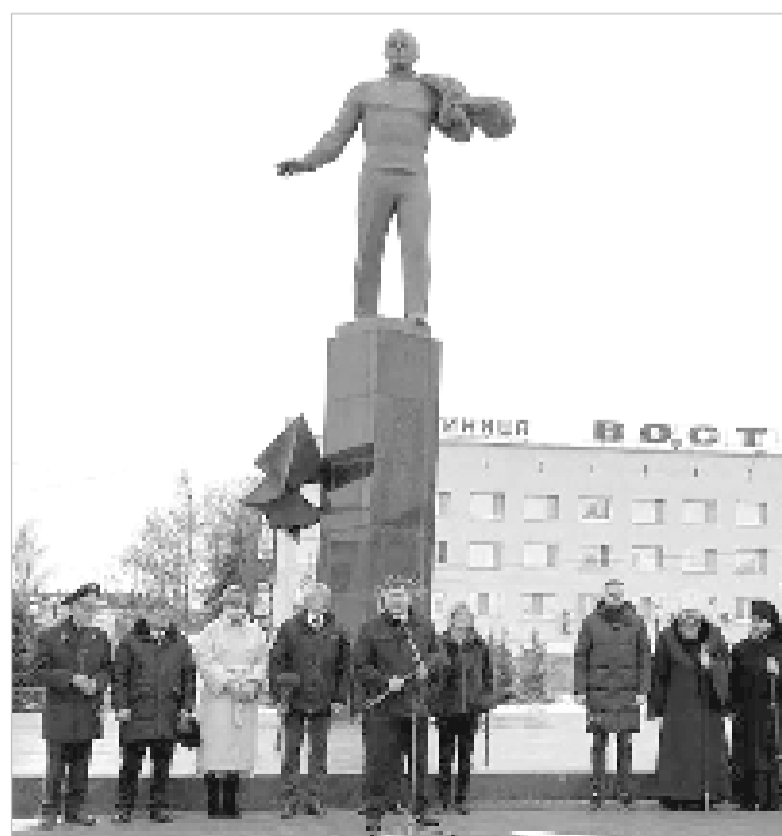
На малой родине Ю.А. Гагарина прошли памятные мероприятия в честь 92-летия со дня его рождения.