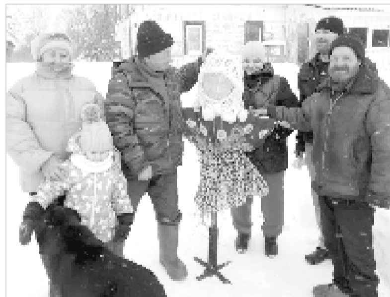
Весну встречаем, зиму провожаем.

В Гаристовском сельском Доме культуры празднование Масленицы прошло в веселой праздничной атмосфере.