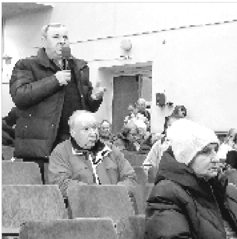
Жители Ельнинского округа открыто задавали депутату Госдумы волнующие их вопросы.