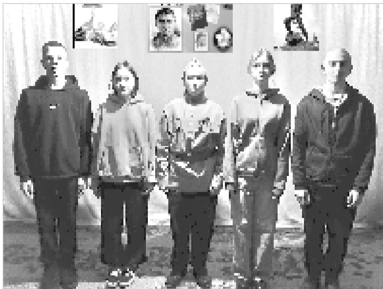
И мужество, и верность рядом с нами...