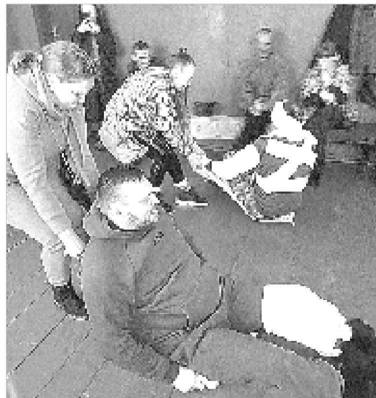
Без женщин никуда.

23 февраля – это праздник настоящих мужчин – смелых и отважных, ловких и надёжных.