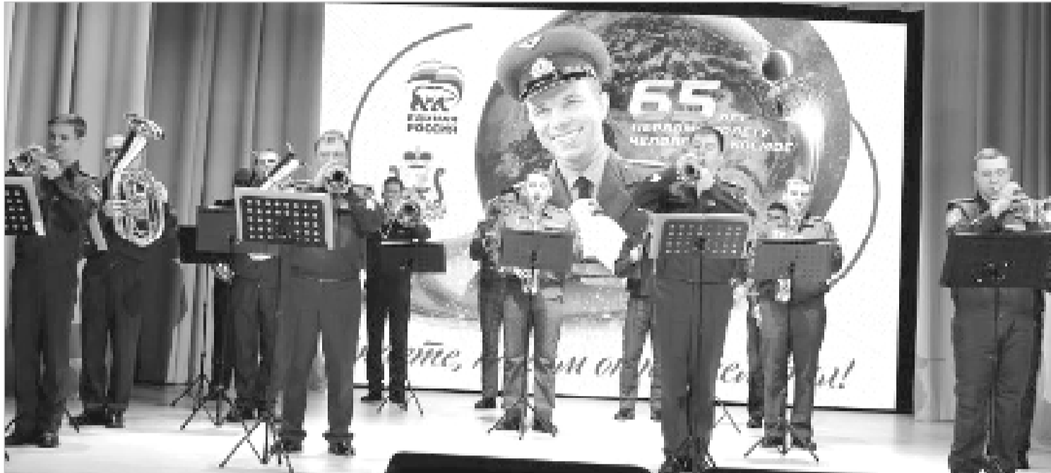
Военный духовой оркестр представит гвардейскую землю в финале гагаринского конкурса.