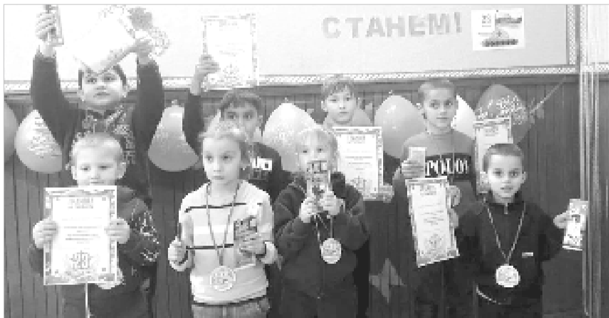
В Старо-Устиновском СДК «Крутые десантники» и «Богатыри» получили заслуженные подарки и медали.