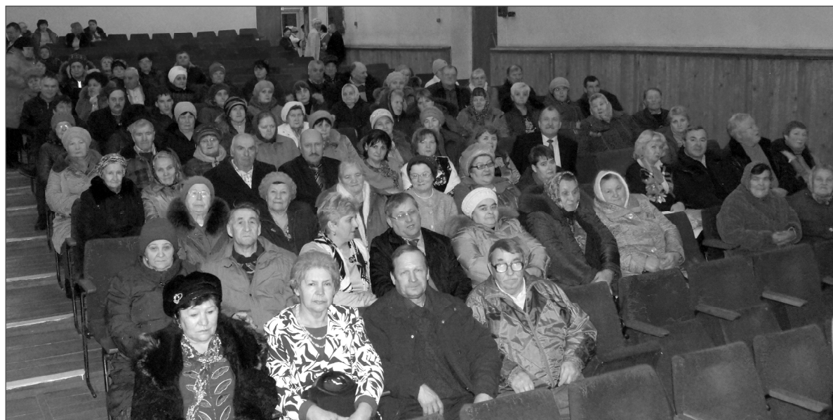
Сердце каждого из сидящих в зале чутко отзывалось на голос гармони.