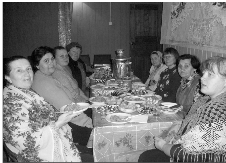
На снимке: удались Кузьминки в Пронине.

ГУМЧС России по Смоленской области информирует