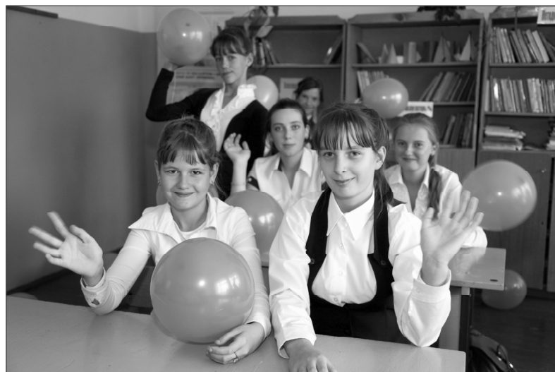
Приятно учиться в такой замечательной школе.