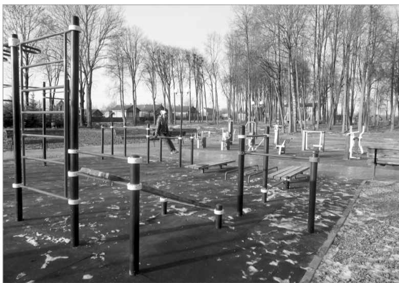
В денежном выражении: оплачено в базовом периоде 2016 года — 1,53 млн. руб., во втором полугодии 2018 года — 1,39 млн. руб.,

в первом полугодии 2019 года — 1,22 млн. руб.