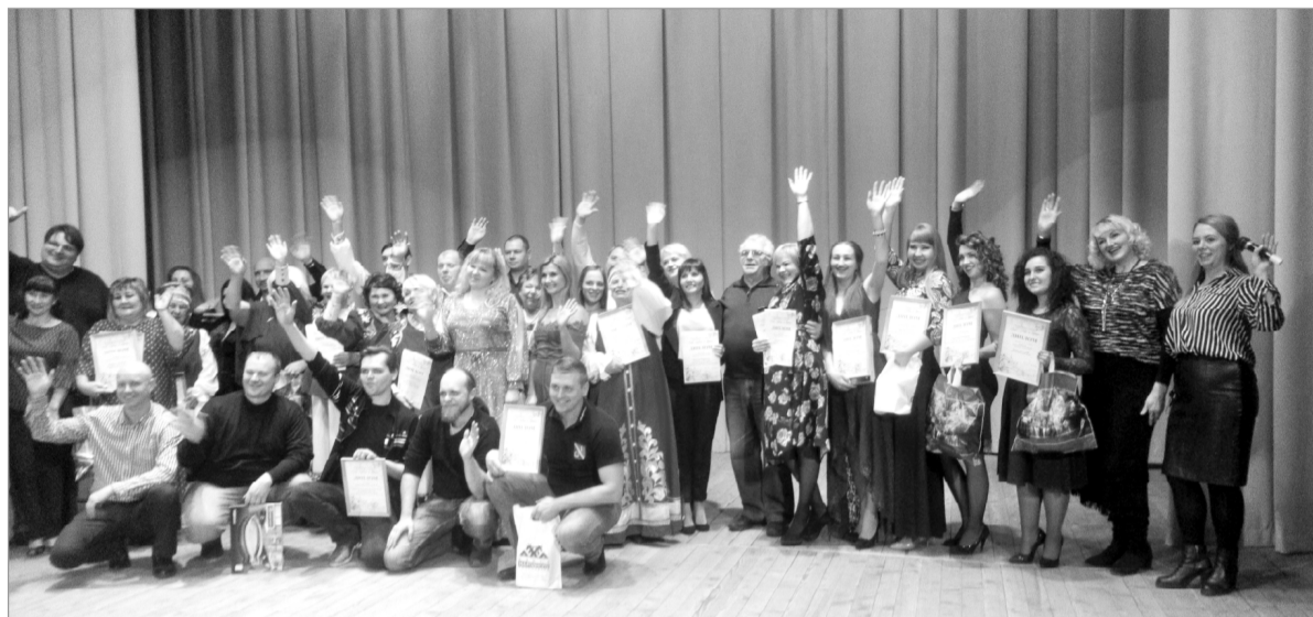
Хроника земли гвардейской