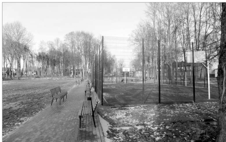
В городском парке теперь можно не только просто отдохнуть, но основательно заняться укреплением здоровья.

Если говорить об экономии, то по сравнению с базовым вторым полугодием 2016 года, на 1 июля 2019 года она составила 101 тыс. 728 кВт-час.