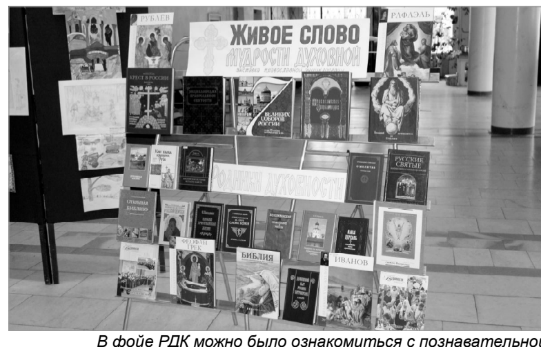
В фойе РДК можно было ознакомиться с познавательной тематической книжной выставкой, подготовленной работниками районной библиотеки.