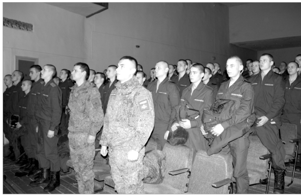
Торжественное единение царило в зале и на сцене.