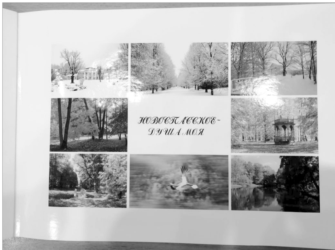
Более 150 замечательных работ в этом фотоальбоме.