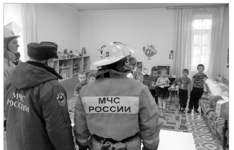
Ельнинские огнеборцы в детском саду «Солнышко».

Помимо этого, личный состав выполнил аналогичную работу в