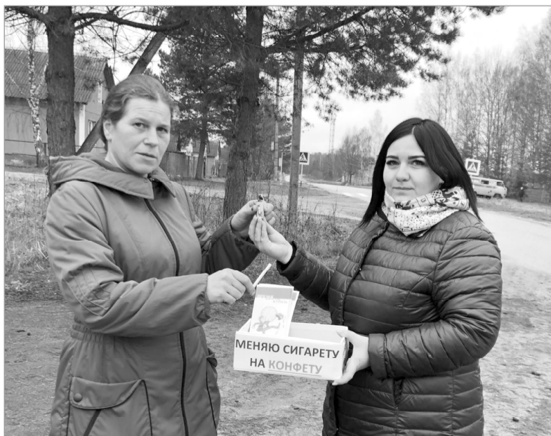
Надеемся, наши земляки выберут здоровый образ жизни.

19 ноября, в Международный день отказа от курения, Коробецкий СДК провел акцию «Меняем сигарету на конфету», направленную на борьбу с табакокурением и пропаганду здорового образа жизни.