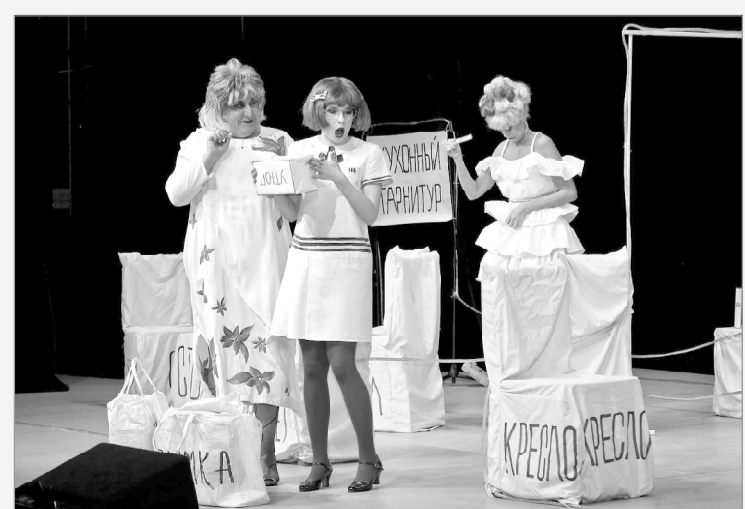
Сцена из спектакля.

Управление информации и общественных связей Смоленской АЭС.