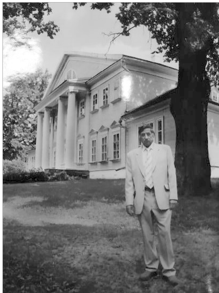
Автор фотоальбома А.Ключников частый гость в Новоспасском.