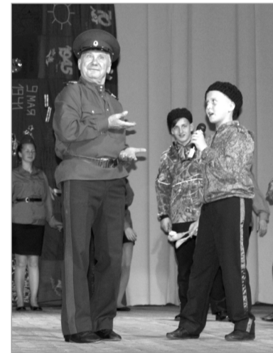
«Живописные» казаки из Вязьмы.

Наверное, потому так глубоко в душу каждого сидящего в зале запали строки из заключительной песни хиславичской команды «И каждый возьмёт своё Знамя Победы».