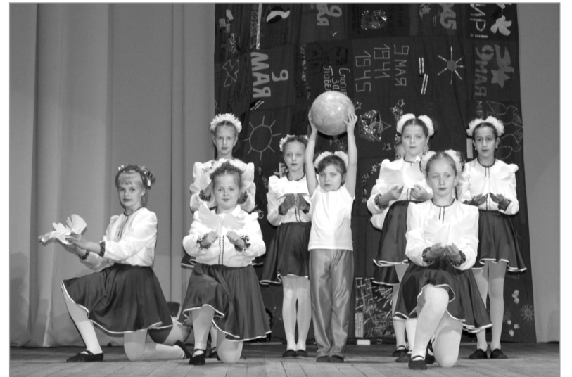
Замечательно выступили наши гости из Белоруссии.

Команда «Патриот» из Духовщины представила на суд жюри поучительную историю о том, что наше самое главное оружие – это память о тех, кто навечно остался лежать на поле боя. А сохранить её мы сможем, только бережно передавая из поколения в поколение. Поэтому так важно беречь эту бес-