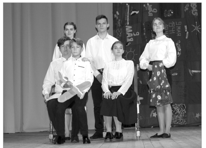
Выступление ребят из Хиславичей.

ценную реликвию, ухаживая за братскими могилами героев и памятниками, установленными на просторах России их благодарными потомками.