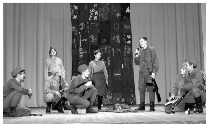
Замечательно выступили ребята из Глинки.