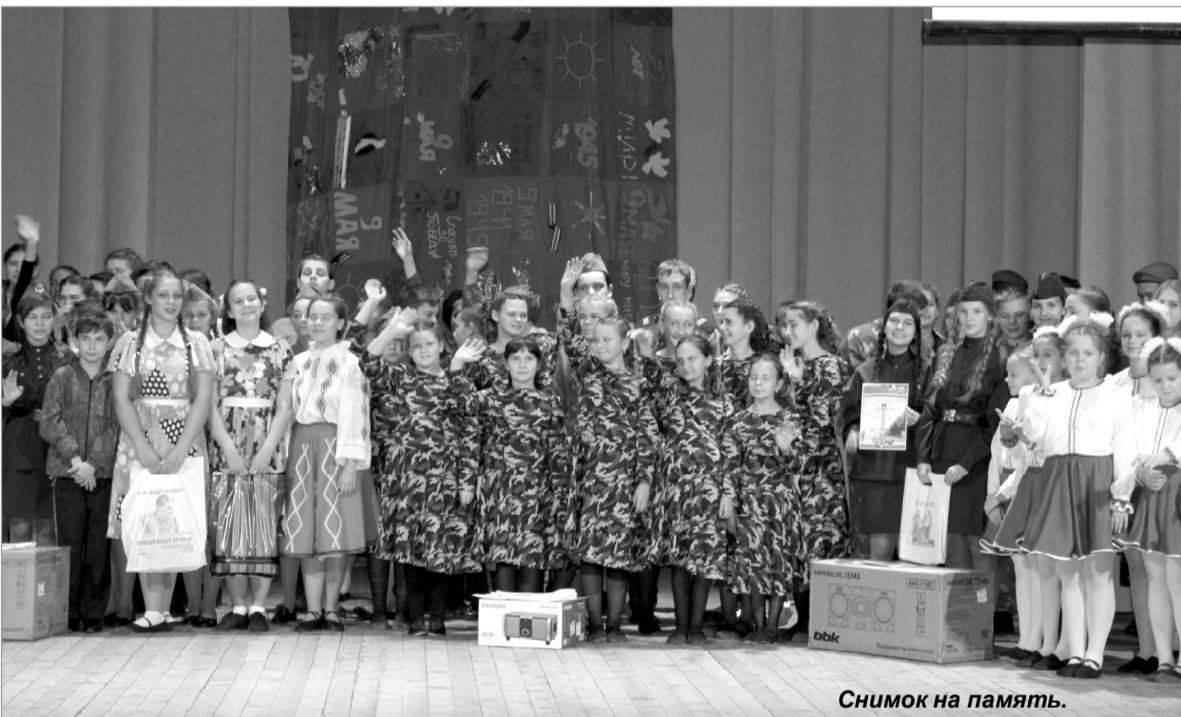
Снимок на память.