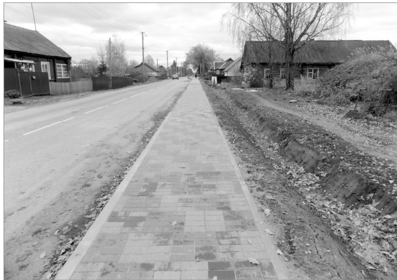
На снимке: радуется глаз тротуар на Кировской, пешеходы довольны.

– Постарались, чтобы город гвардейской славы смотрелся до-