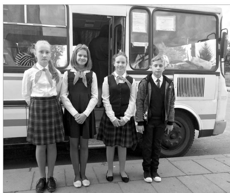
На снимках: пассажиры с удовольствием слушали ребят; к следующему рейсу готовы!

Особенно порадовали пассажиров первоклассники, которые с большим энтузиазмом, вместе с учителем Н.П.Ананьевой, включились в акцию «Читающий авто-