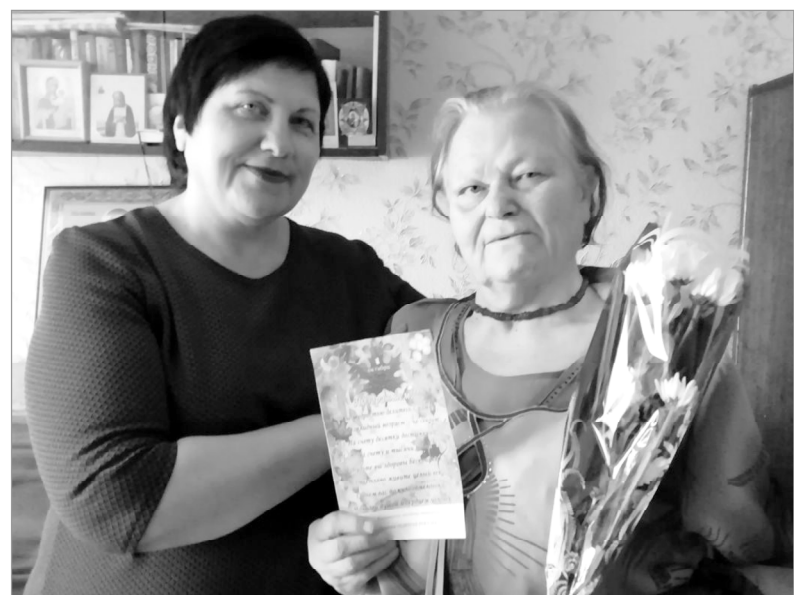
В партиях и движениях

Депутат Смоленской областной Думы Михаил Лосенко.