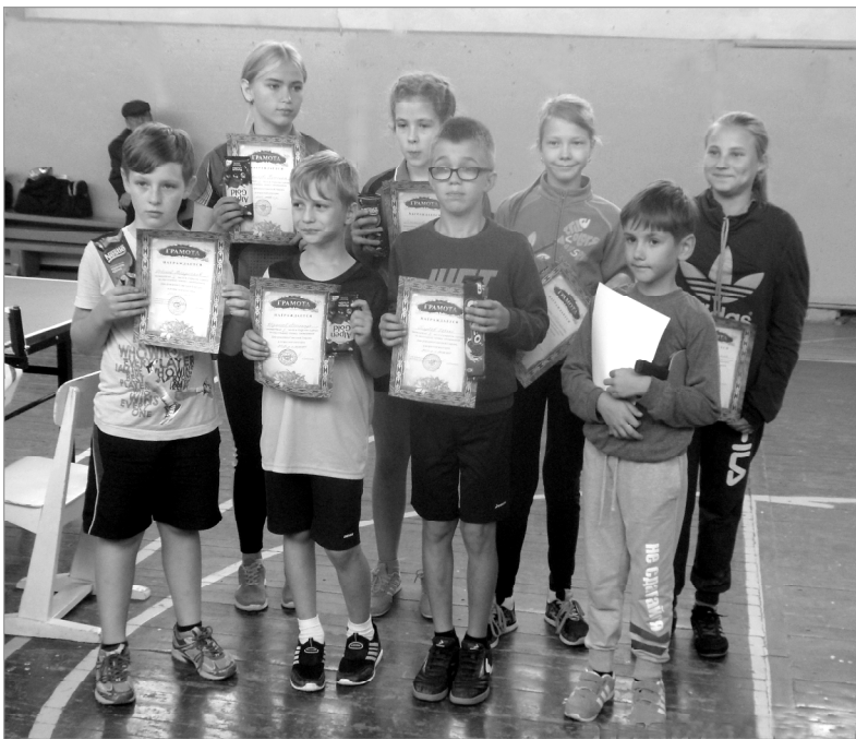
Вот они – наша гордость и наша надежда.