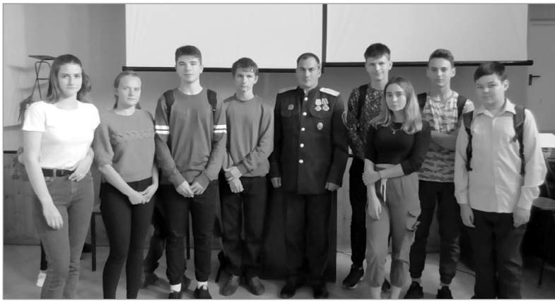
Ребята охотно сфотографировались на память с казачьим атаманом.