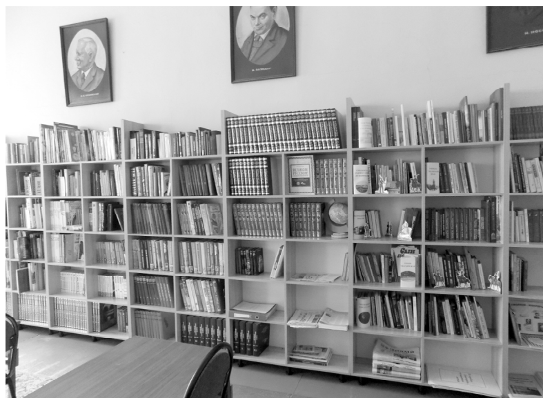
На снимке: новые стеллажи в детском читальном зале.