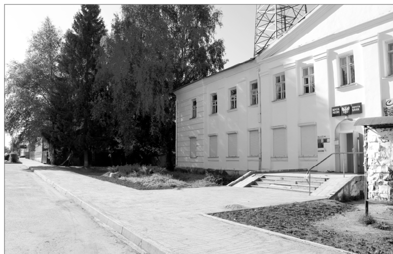
На снимке: новый тротуар украсил центр Ельни.