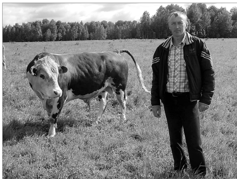
Люди гвардейской земли: встречи для вас

В нынешнем году породистого быка-производителя Степан