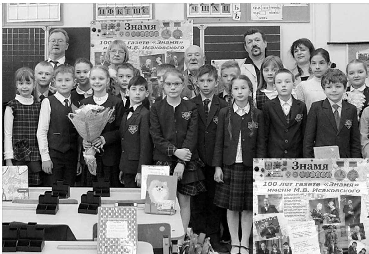
К 100-летию газеты «Знамя»