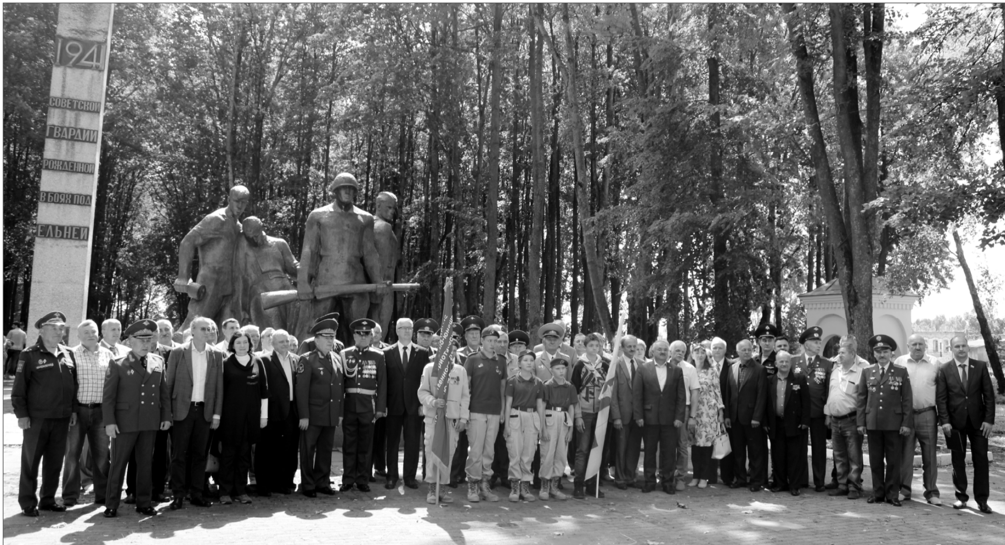
Хроника земли гвардейской