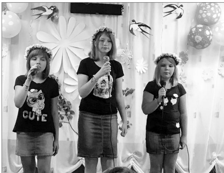
Если дети поют – значит, всё хорошо!

У работников Павловского сельского клуба есть добрая традиция – готовить большую концертную программу ко Дню семьи, любви и верности. Так было и в этом году.