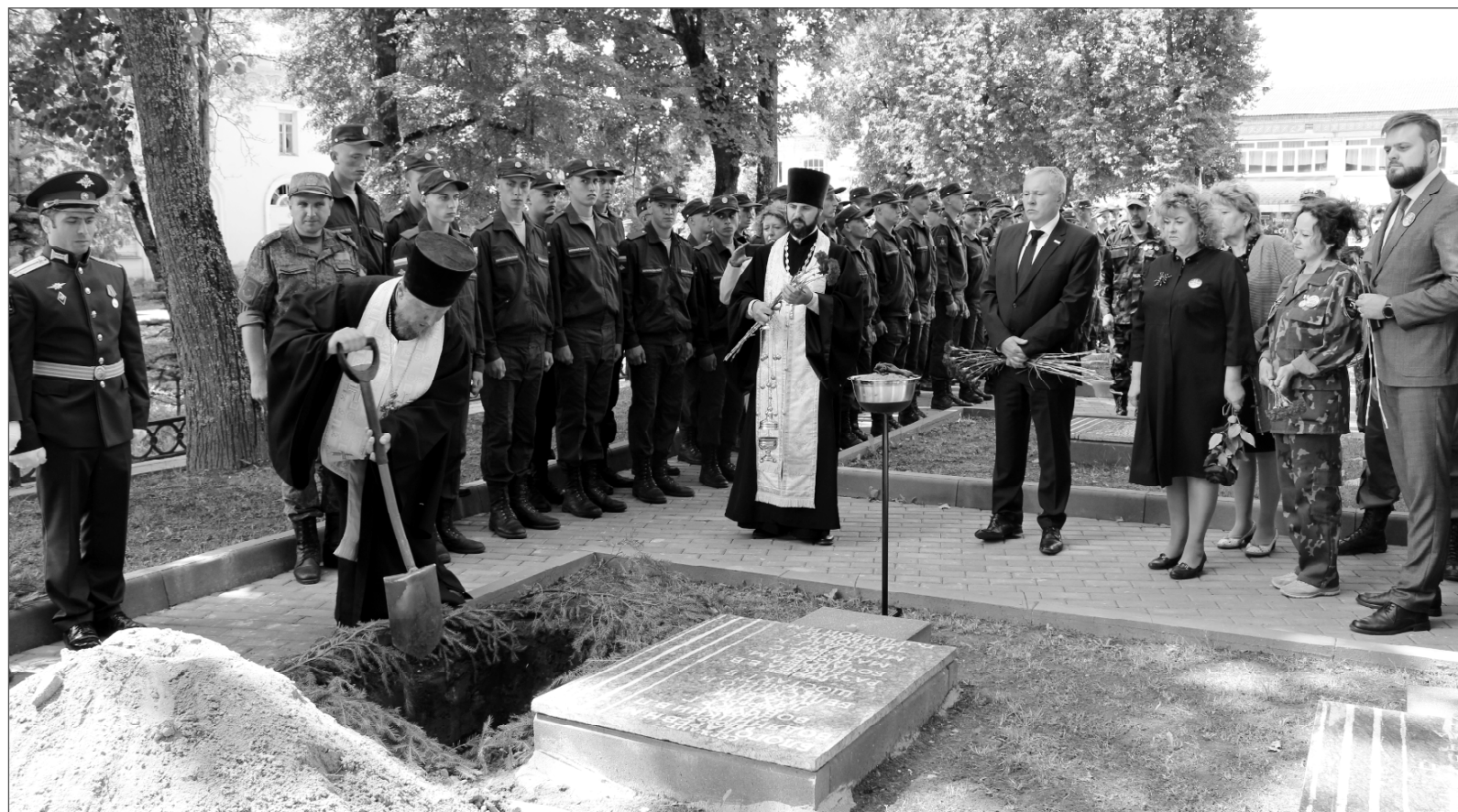
Останки героя нашли упокоение на воинском кладбище в сквере Боевой Славы, рядом с могилой его сестры.