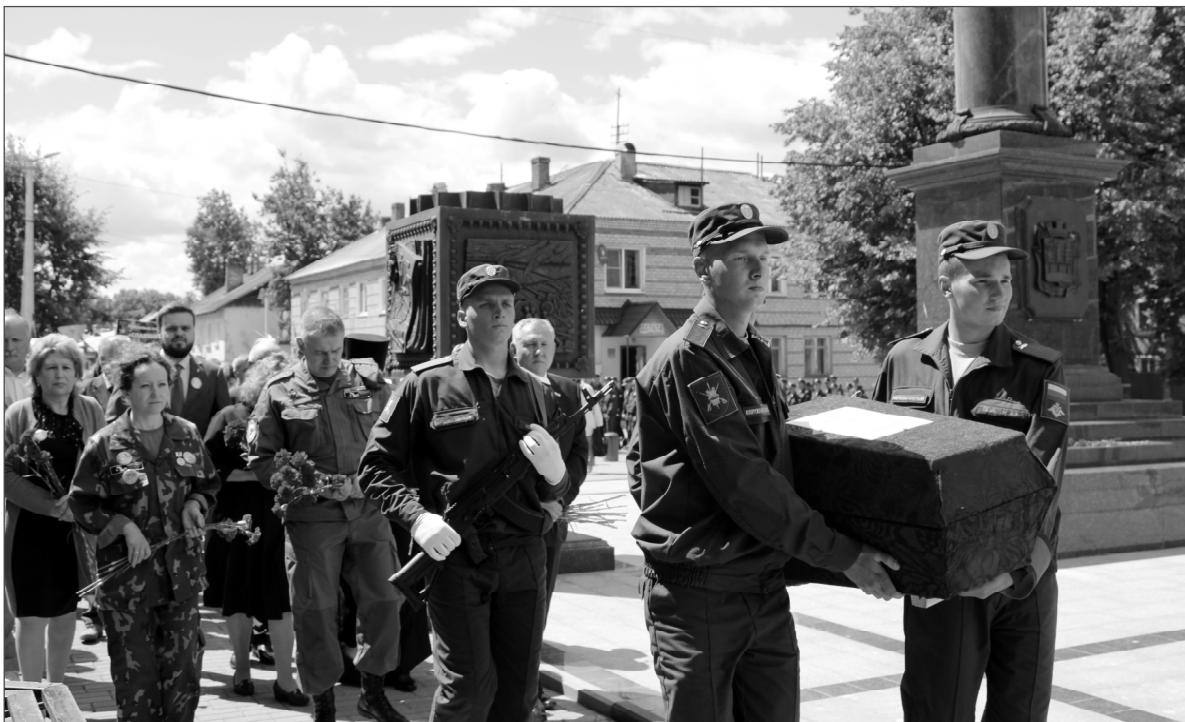
(Начало на 3-й стр.)