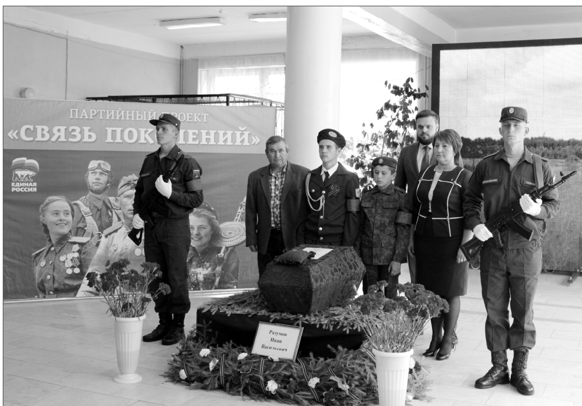
Фойе РДК. Не прерывается связь поколений.