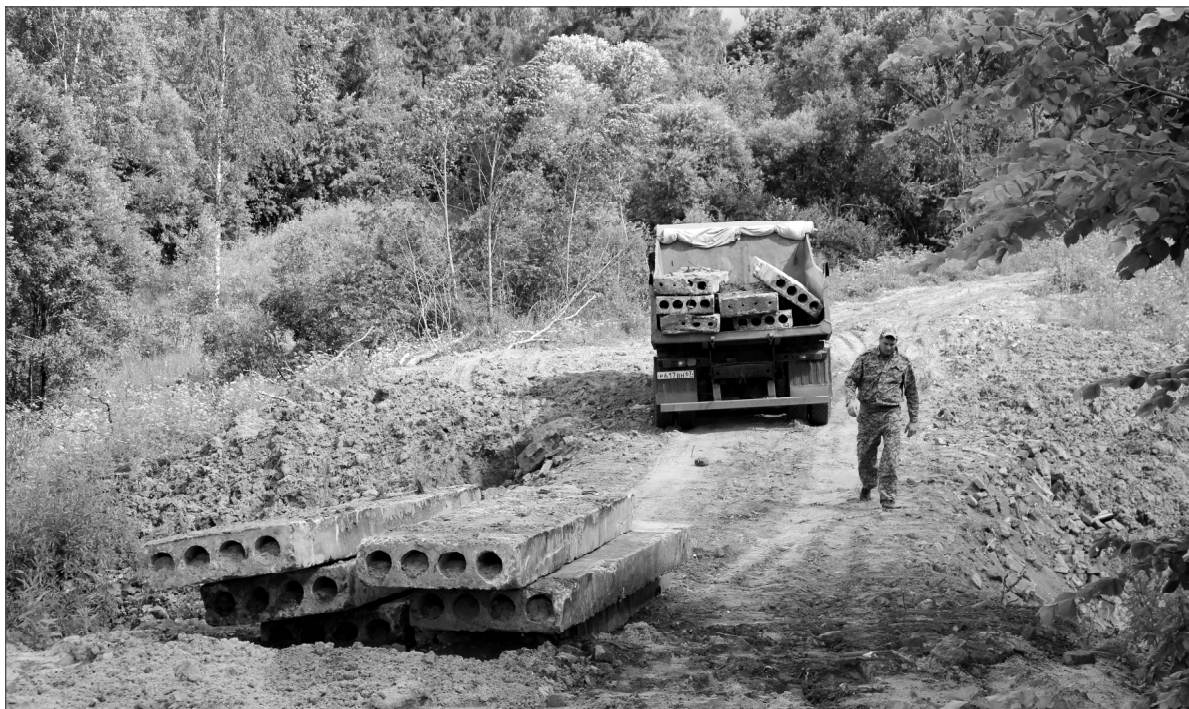
Ныне было решено дополнительно укрепить насыпь.

Самые тёплые слова благодарности за внимание и заботу о лю-