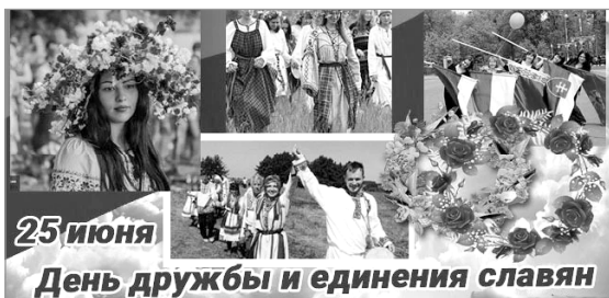
25 июня День дружбы и единения славян

1 05.00, 09.25 "Доброе утро" 09.00, 03.00 Новости 09.55, 02.30, 03.05 "Модный приговор". (6+) 10.55 "Жить здорово!" (16+) 12.00, 15.00 Новости 12.15, 17.00, 18.25 "Время покажет". (16+) 15.15, 04.10 "Давай поженимся!" (16+) 16.00, 03.20 "Мужское / Женское". (16+) 18.00 Вечерние новости 18.50, 01.30 На самом деле. (16+) 19.50 "Пусть говорят". (16+) 21.00 Время 21.30 Т/с "АНГЕЛ-ХРАНИТЕЛЬ" (16+) 23.30 Т/с "ЭТИ ГЛАЗА НАПРОТИВ" (16+)