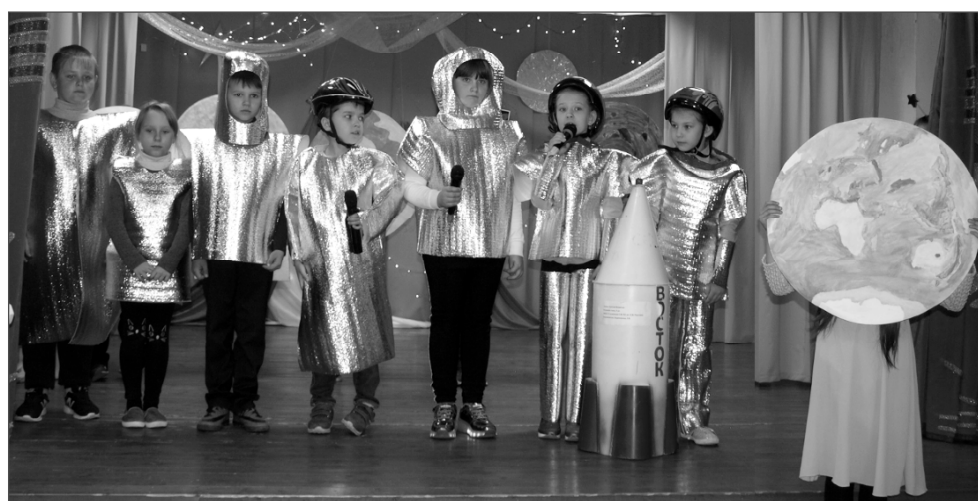
Эффектные костюмы и декорации смастерили ребята к конкурсу (школа № 2).