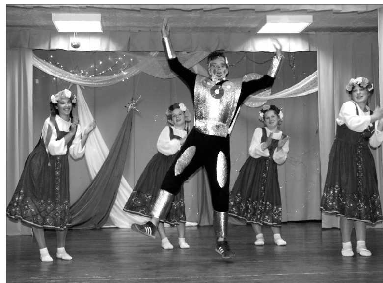
Иноплетантин Вася из Богородицкого покорил землян.

Следует отметить высокий уровень организации фестиваля, который со свойственен всем мероприятиям, которые проводит коллектив Ельнинского Центра творчества. Здесь всегда царит дух неиссякаемого патриотизма и любви к своей малой родине и нашей огромной России. Дети из разных