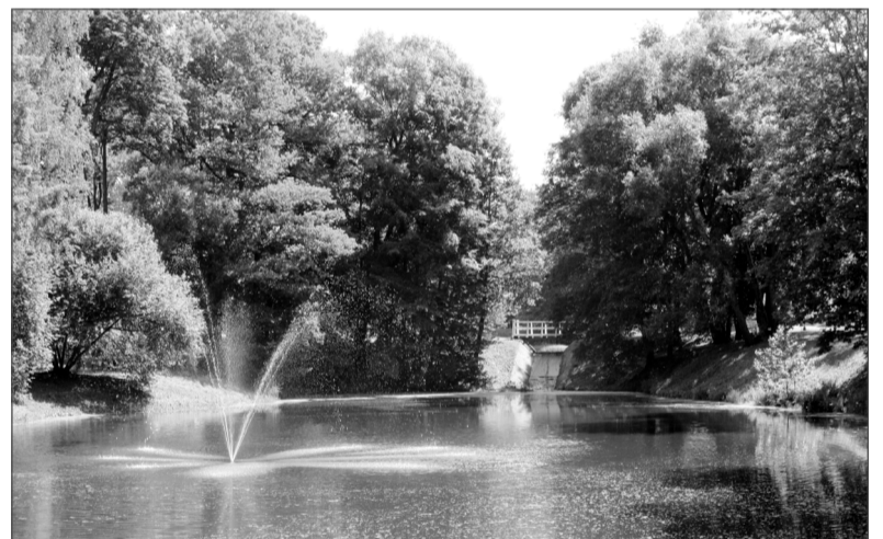
Не зря Глинка называл Новоспасское раем земным.

Радостное настроение гостям Музея-усадьбы создавали фольклорные коллективы, приехавшие из разных районов Смоленщины. Надо сказать, что их талантливое творчество никого не оставило равнодушным. Пожалуй, общее мнение выразил один из зрителей: «Всем спасибо за доставленное