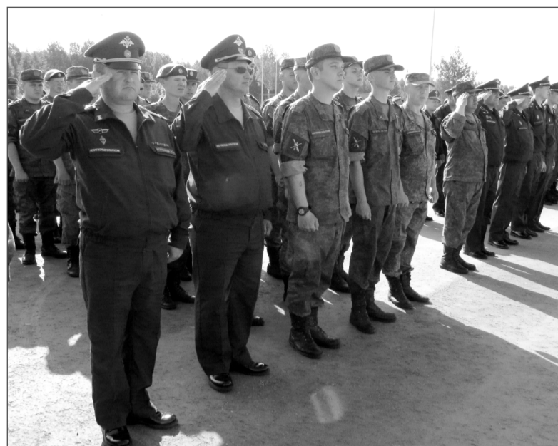
На снимках: военнослужащих приветствует Глава района; на строевом плацу личный состав дивизии.