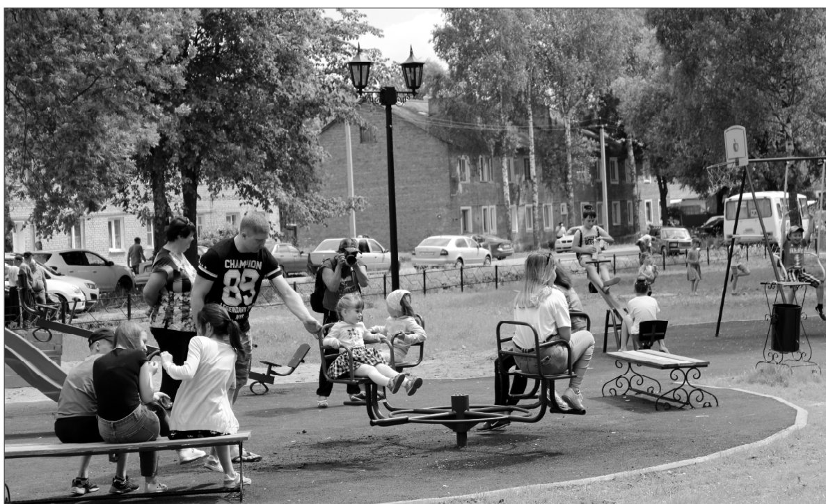
Этот любимый уголок отдыха вновь звенит детскими голосами.