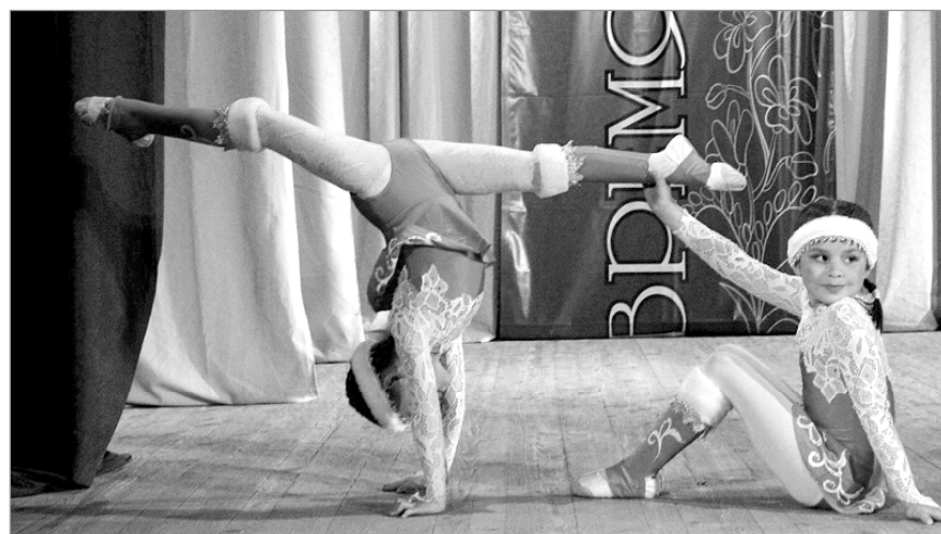
Самые маленькие артистки с номером «Валенки».