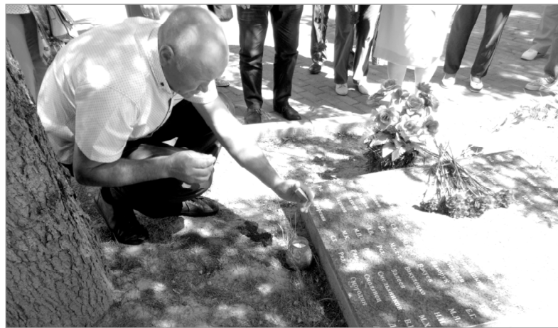
Собравшиеся возложили цветы на могилы братского кладбища и к Вечному огню.