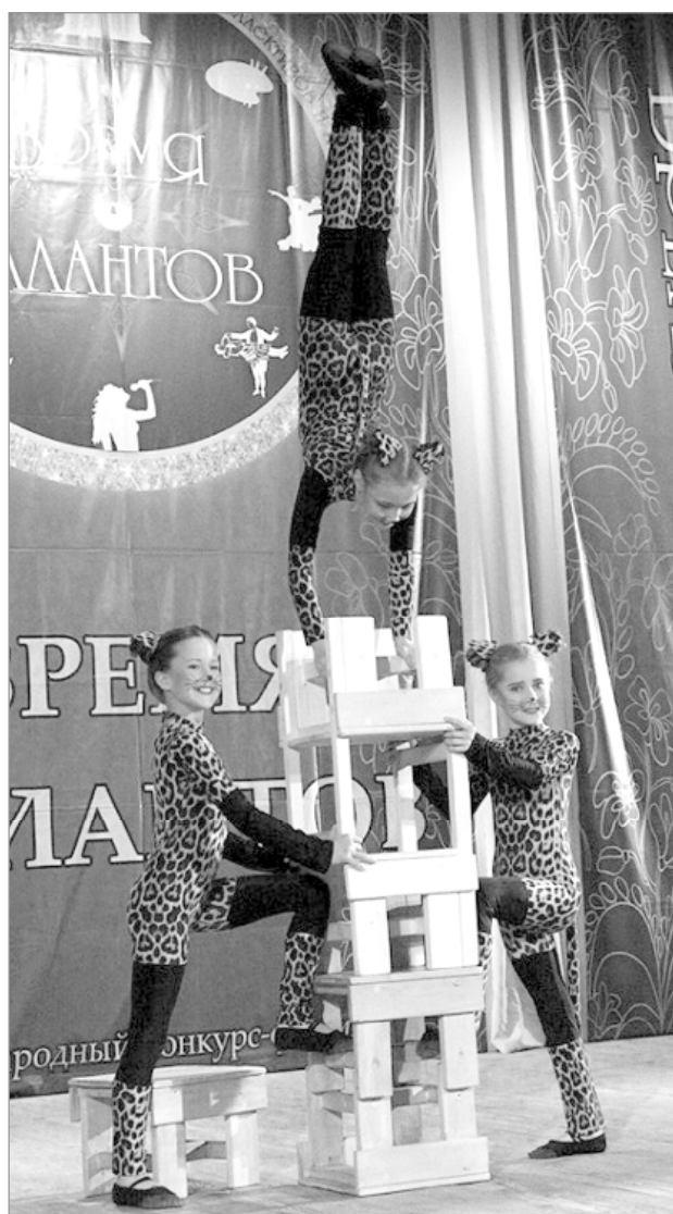
Наши «кошки» покорили всех!