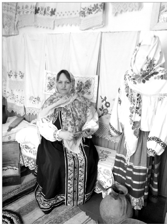
На снимке А.Юдина.

– Мне очень приятно, что нашу неуклонную краеведческую рабо-