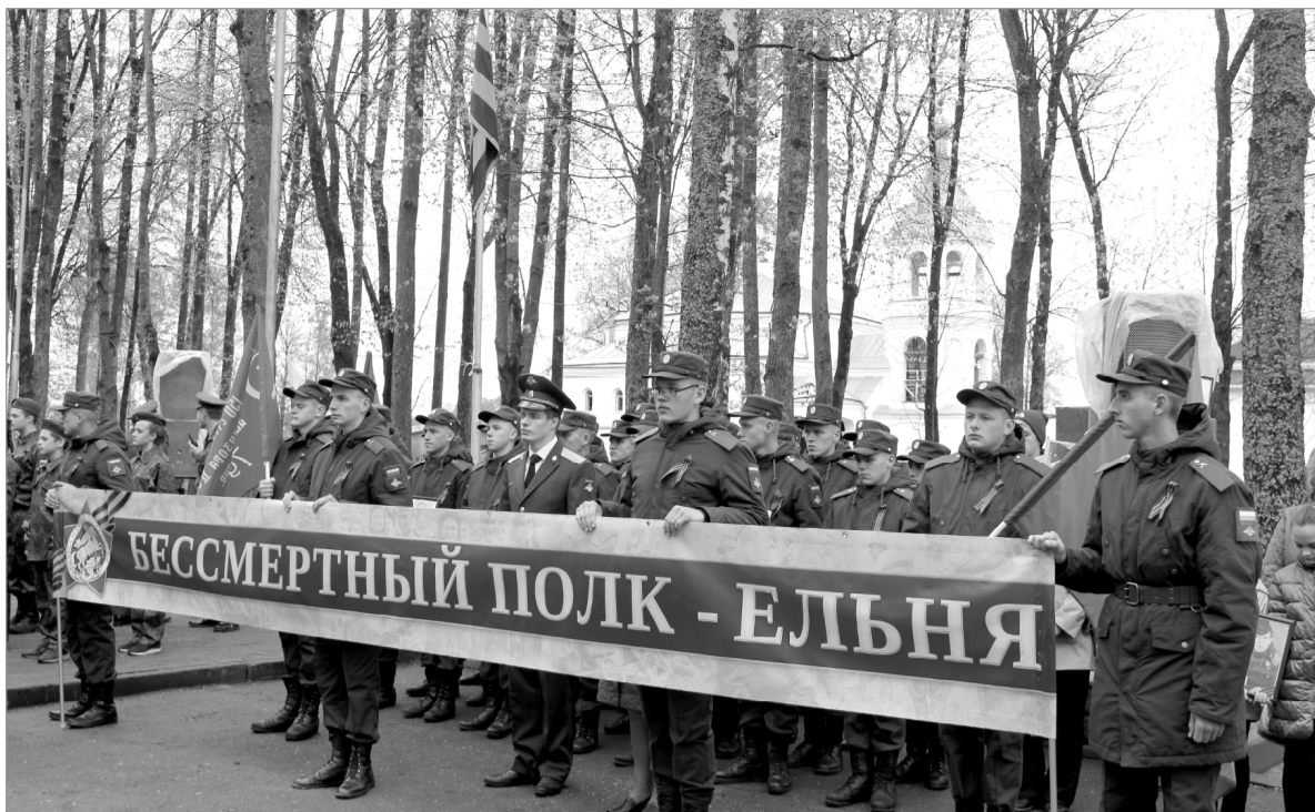
На снимках: сквер Боевой Славы: в Бессмертном полку военнослужащие и сотни ельнинцев.

Ну и конечно же, никто не смог усидеть на месте под зажигательные казачьи танцы участ-