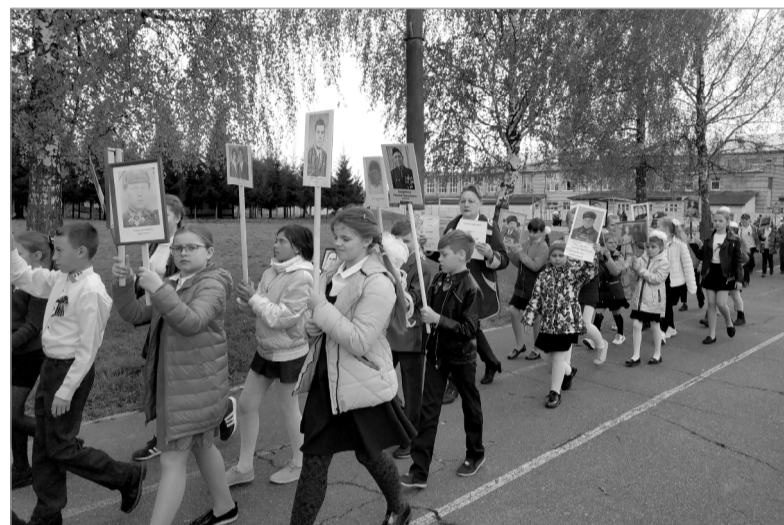
Эти дети растут настоящими патриотами, как их предки.

Хочется от всей души поблагодарить родителей, бабушек и дедушек, которые поддержали своих детей и внуков и приняли активное участие в восстановлении имен родственников, участников Великой Отечественной войны. Это очень важно для воспитания у подрастающего поколения патриотизма, как высшей человеческой ценности. Если у ребенка в семье есть конкретные примеры бескорыстной любви к Родине и жива память о родственниках, ее защищавших, можно с уверенностью сказать: