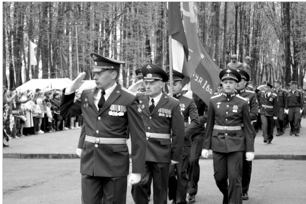
Идёт знаменная группа.