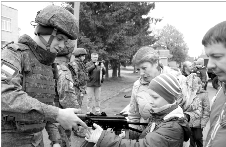
Военнослужащие Ельнинского гарнизона с удовольствием демонстрируют современное оружие.