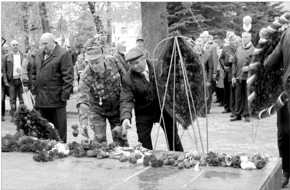
На снимках: сквер Боевой Славы. Вечная память павшим. Словно помолодела гвардейская Ельня с возвращением военных.