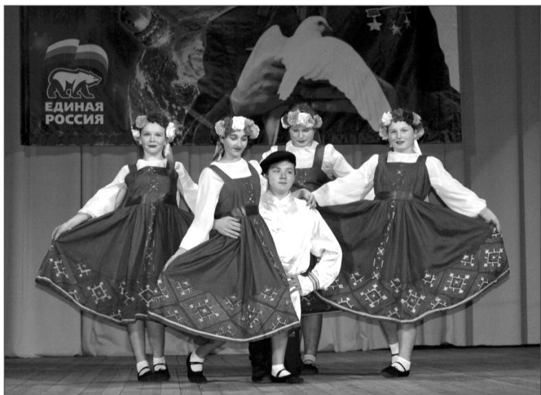
На сцене «Задоринки» из Богородицкого.

Организатор конкурса в рамках партийного проекта «Историческая память» – Смоленское региональное отделение Партии «Единая Россия».