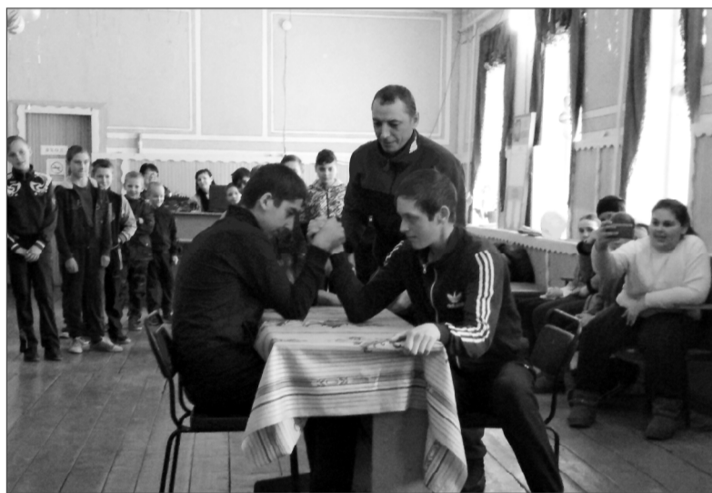
Была возможность и силушку показать.

В начале мероприятия ведущие рассказали об истории праздника, представили команды и жюри. Затем бразды правления они переда-