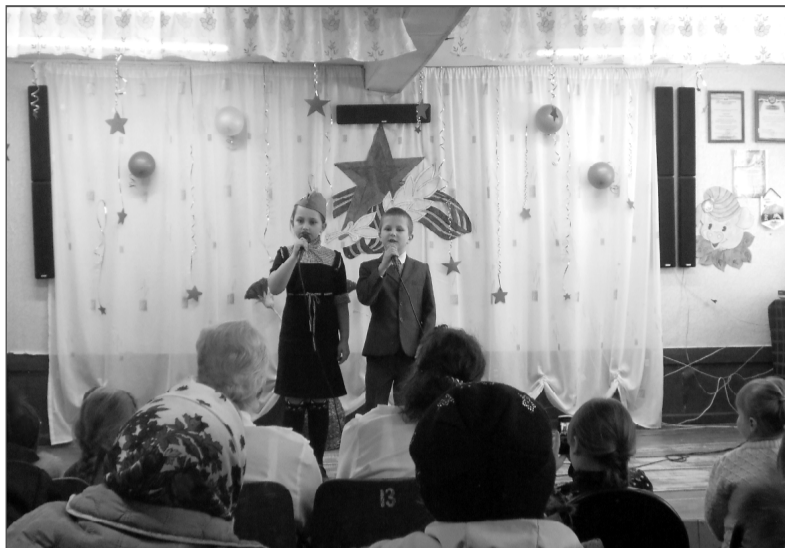
Наши юные артисты старались от души!

23 февраля – это не просто праздник военных, это праздник души защитника Родины, Отечества, семьи, друзей и, конечно же, женщин.