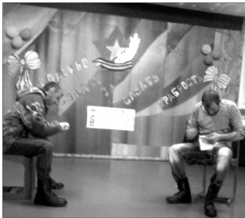
Сила-то есть, а вы попробуйте пуговицу пришить!