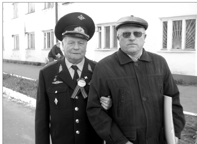
М.К.Козлов с космонавтом В.В.Горбатко.

– Люди в России хорошие, талантливые, а мы, американцы, всегда будем помнить, что ваш земляк Юрий Гагарин открыл до-