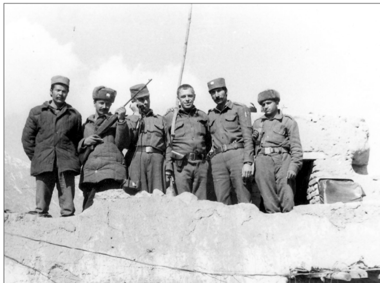
Афганистан. Март 1988 г.

ка информации. Такая же тенденция прослеживалась и у высших военачальников царандоя, и у представителей Министерства национальной обороны Афганистана, с которыми приходилось встречаться по долгу службы. Поэтому при планировании операции, о чём мы должны были им докладывать, время её начала не говорили никогда.