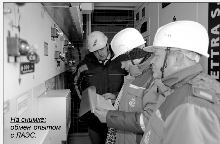
На снимке: обмен опытом с ЛАЭС.

Управление информации и общественных связей Смоленской АЭС.