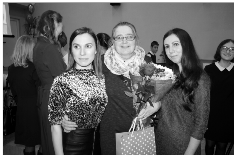
Сколько трогательных и незабываемых моментов подарил этот вечер и педагогам, и их повзрослевшим ученикам!