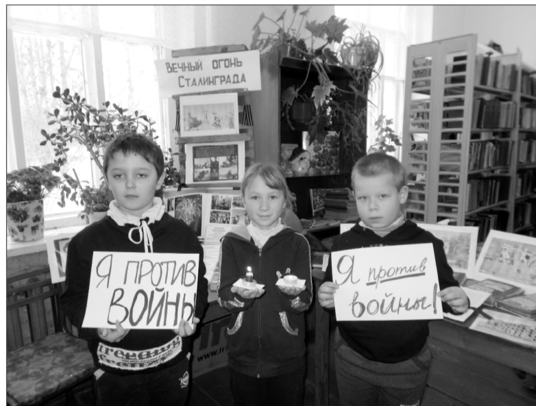
Час-реквием в Богородицкой библиотеке.

Нам хотелось, чтобы все услышанное и сказанное нашло отклик