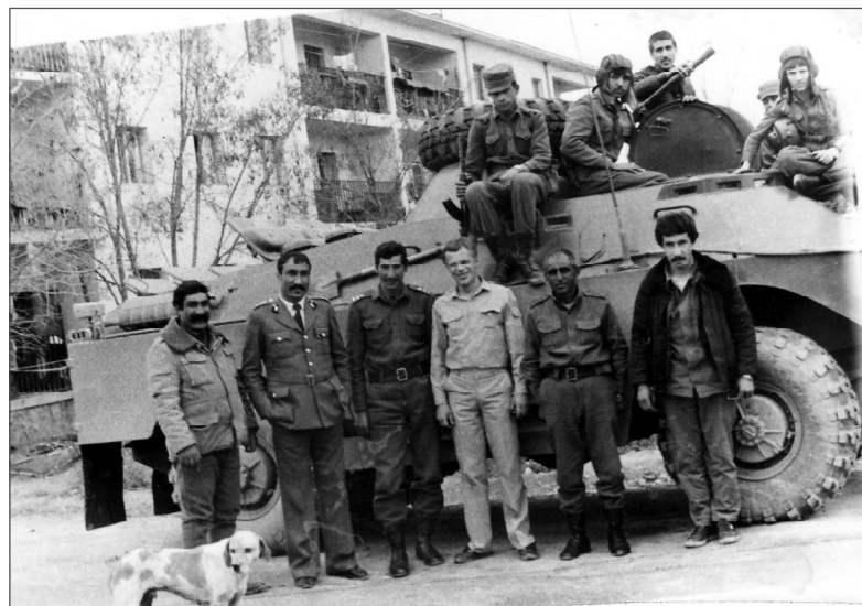
Афганистан. Апрель 1988 г.