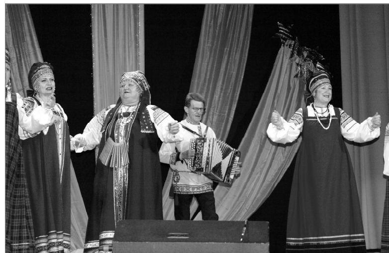
Журчит народными напевами «Реченька».