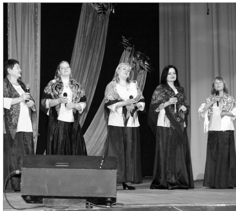
Наша «Надежда» давно завоевала сердца ельнинцев.