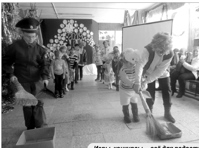
Игры, конкурсы – всё для радости и веселья!