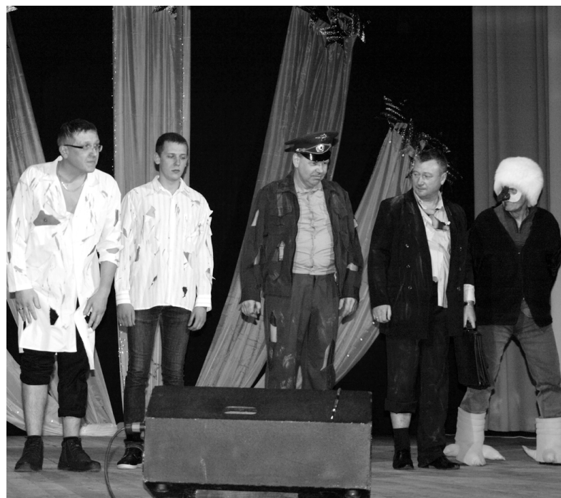
Шуточная сценка в исполнении артистов студии «Отцы и дети».