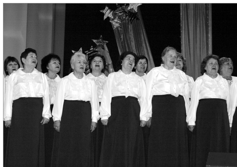
Наша гордость – «Гвардейские мадонны».