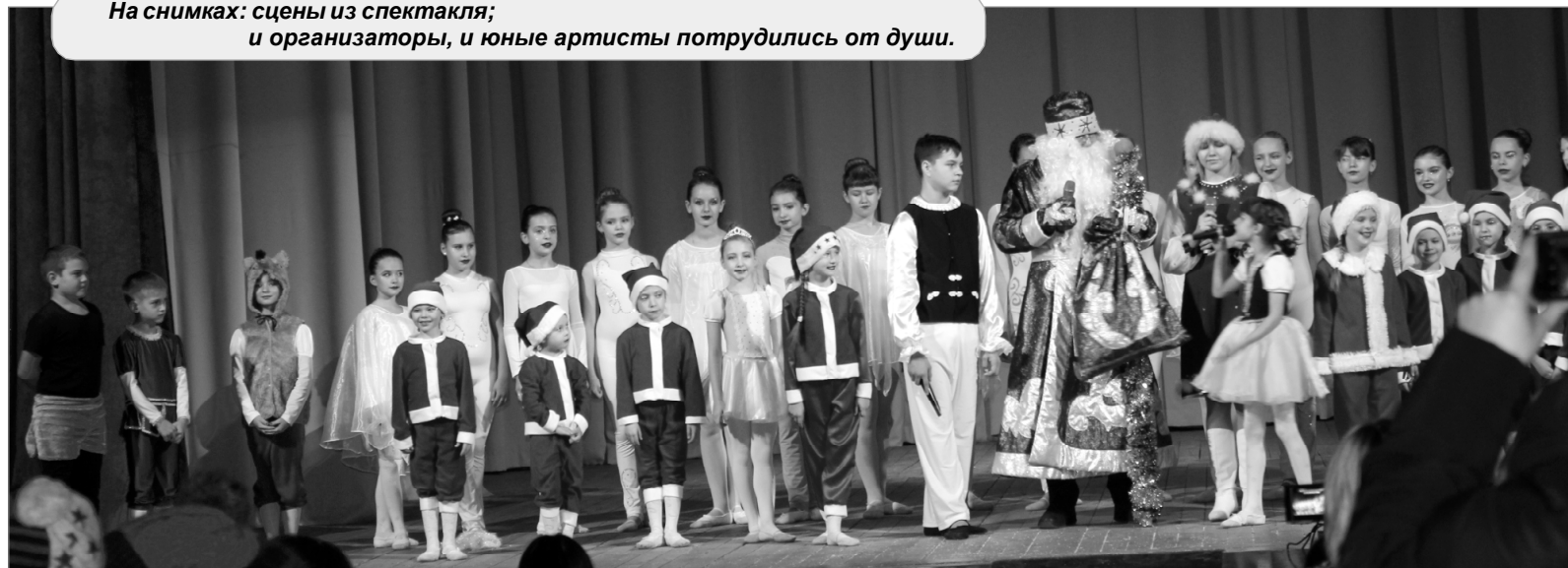
На снимках: сцены из спектакля; и организаторы, и юные артисты потрудились от души.