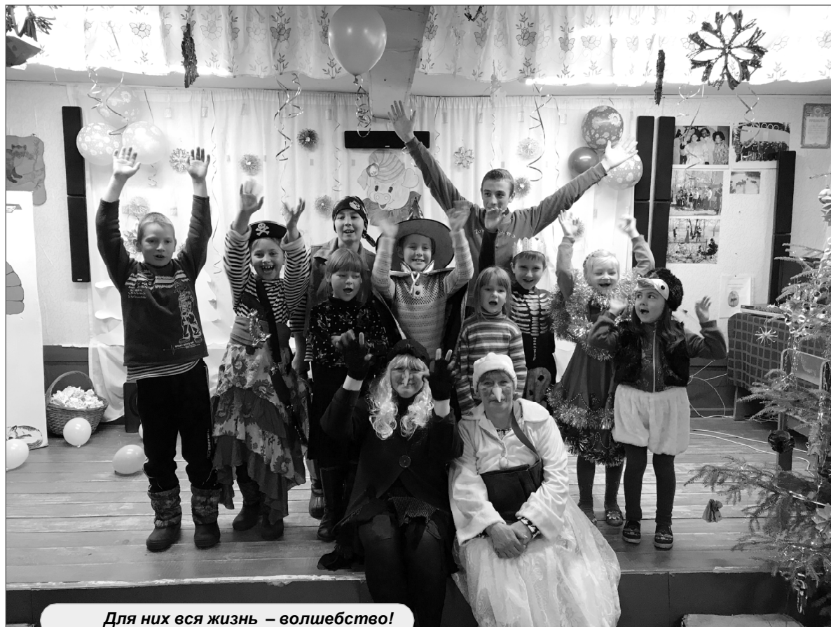
Для них вся жизнь – волшебство!