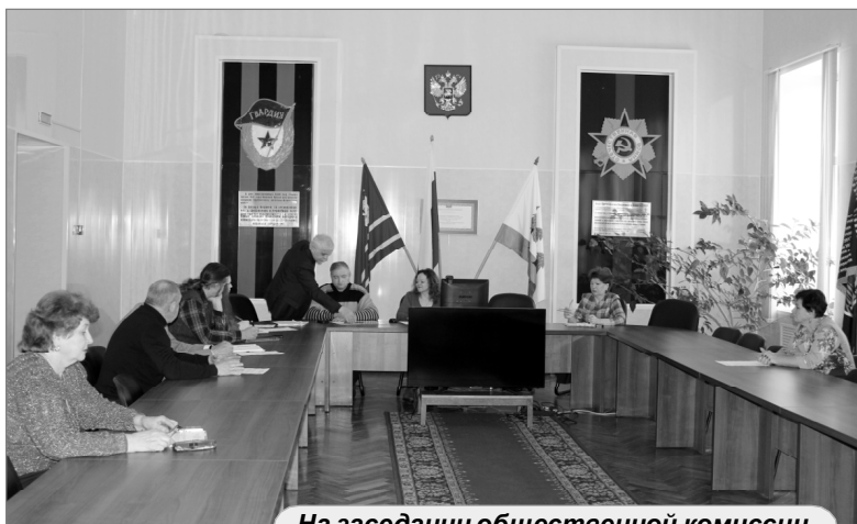
На заседании общественной комиссии.

льефу местности и другим основополагающим условиям.