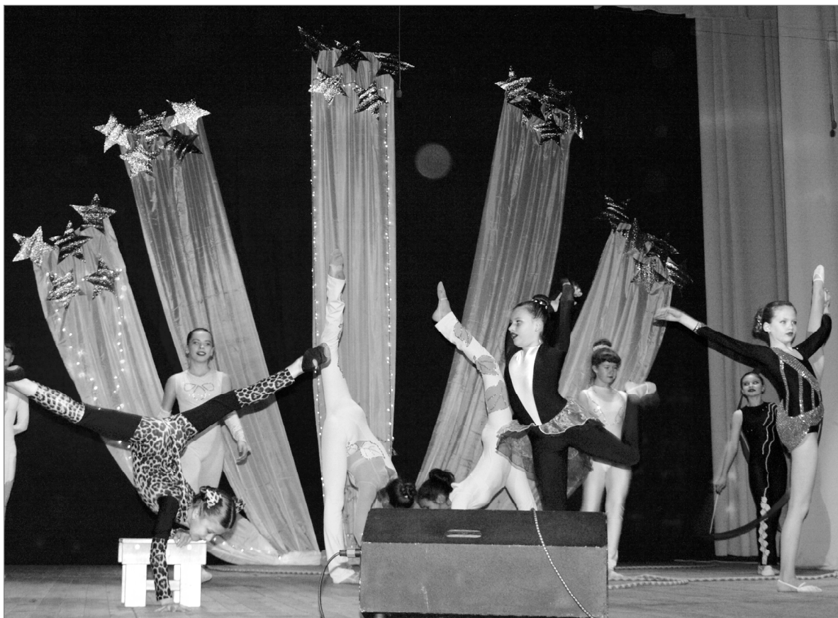
Юные гимнасты цирковой студии «Фламинго» покорили всех.