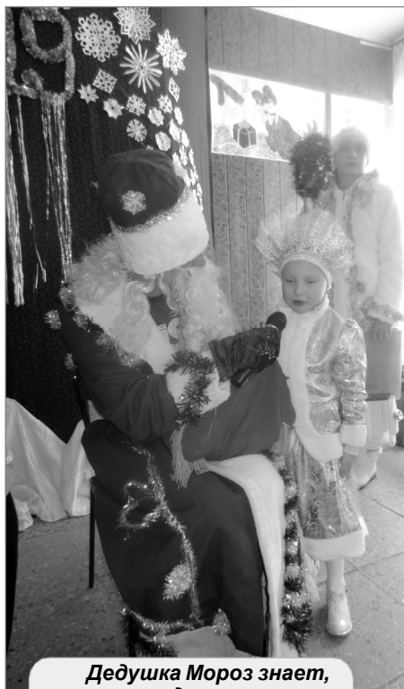
Дедушка Мороз знает, что дети желают.

4 января в Пронинском СДК прошел новогодний утренник для детей. Открыла его Бабушка Арина, которая позвала к детям самого главного гостя – Деда Мороза. Но он пришел на праздник один, его Снегурочка где-то заплутала в лесу.