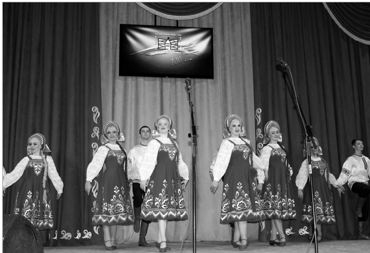
Замечательная концертная программа была подготовлена для юбиляров.