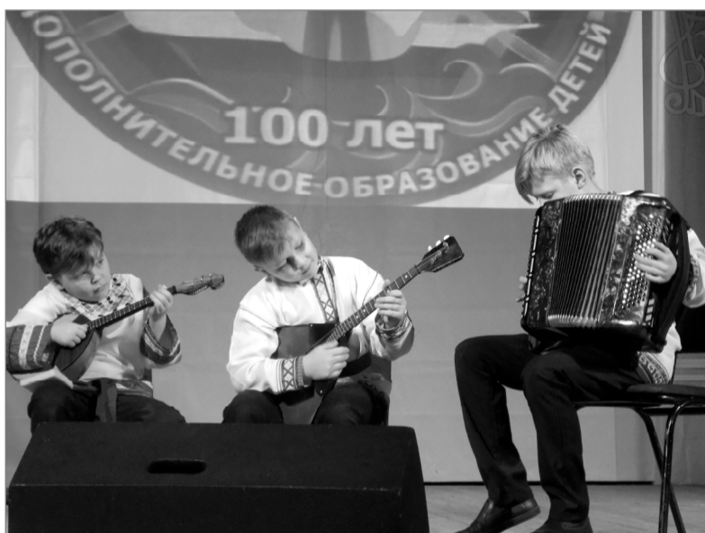
Выступает трио Ельнинской музыкальной школы.