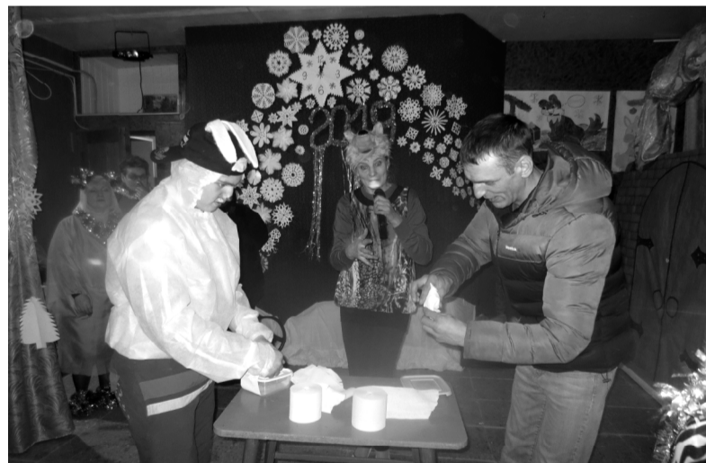
Работники СДК постарались сделать вечер незабываемым.

Ельнинское райпо сообщает, что с 11 января организацией горячего питания учащихся в трёх городских школах занимается отдел образования Администрации МО «Ельнинский район». Инициатором расторжения договора по организации питания является районная администрация.