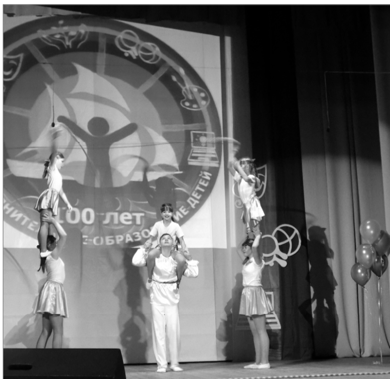
Выступают юные артисты цирковой студии «Фламинго».