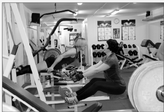
Спортивный клуб «Самсон».

«Каждый желающий, вне зависимости от того является он работником Смоленской АЭС или нет, может заниматься спортом в клубе «Самсон», причем абсолютно бесплатно. И я тому пример, третий год занима-