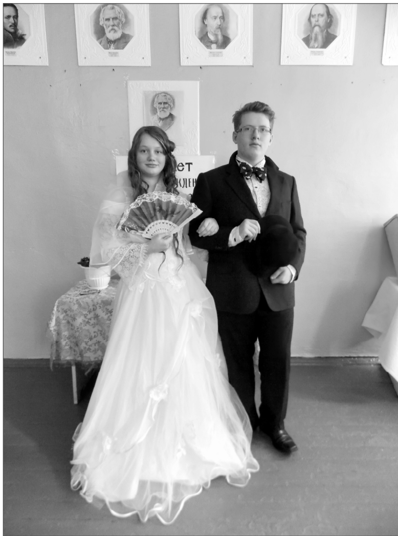
Ну чем не тургеневские герои?!

Литературный праздник оставил в душе ребят неизгладимое впечатление. Заочная встреча с писателем закончилась, но тайна многогранной личности великого мастера слова ещё разгадана не до конца. Её предстоит разгадывать многим последующим поколениям и неустанно удивляться бессмертным произведениям, кото-