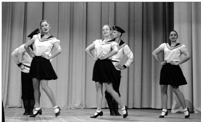
Красота, молодость, задор — всё есть в выступлениях наших дорогих гостей, студентов МИИТа.