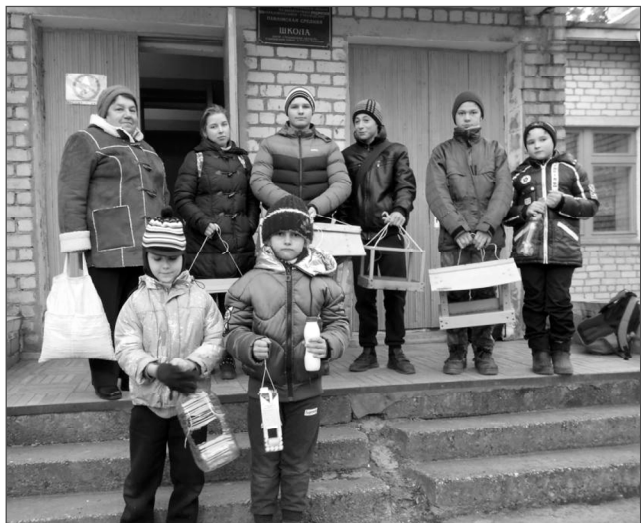
Наши ребята не оставят птичек голодными.

В нашей школе всегда уделяется большое внимание воспитательной работе.