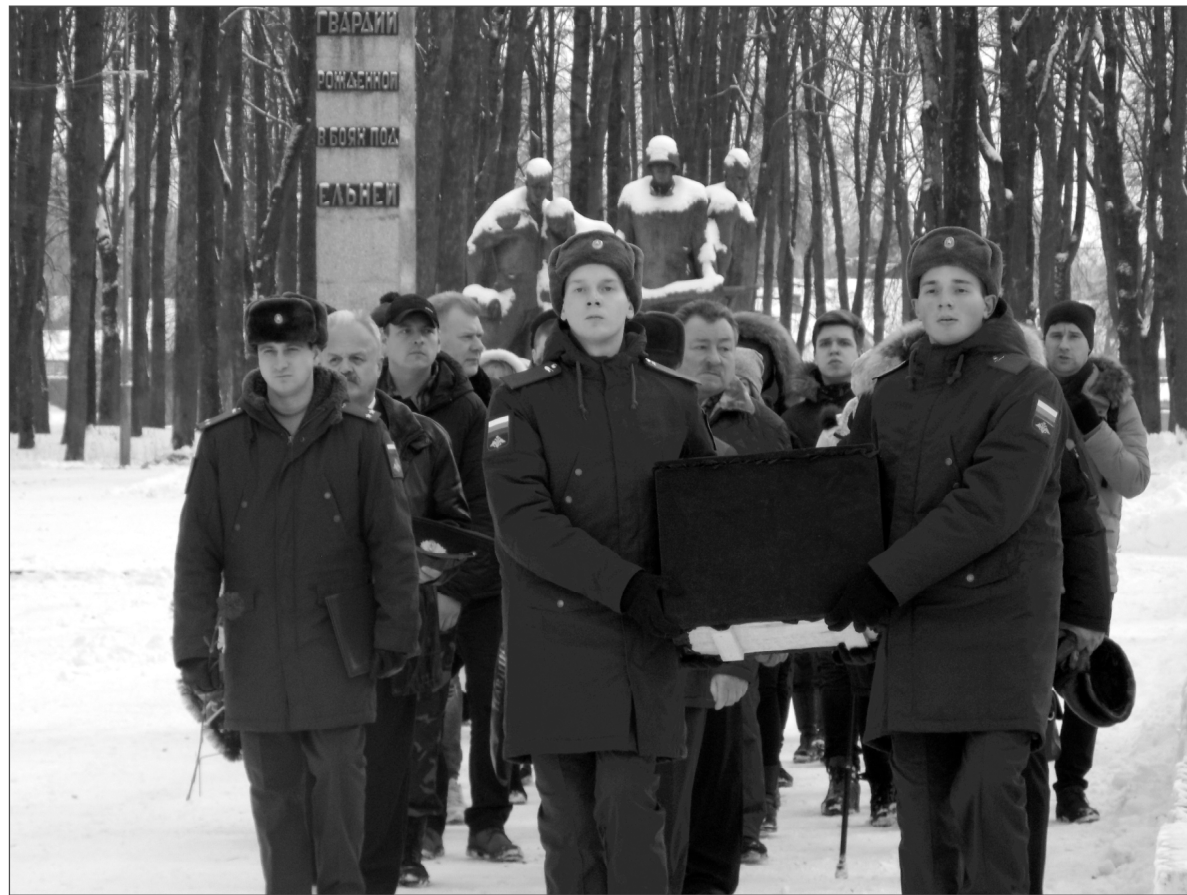
Траурная процессия направляется к месту захоронения.

значит и вернуть имя получается только одному солдату из ста.