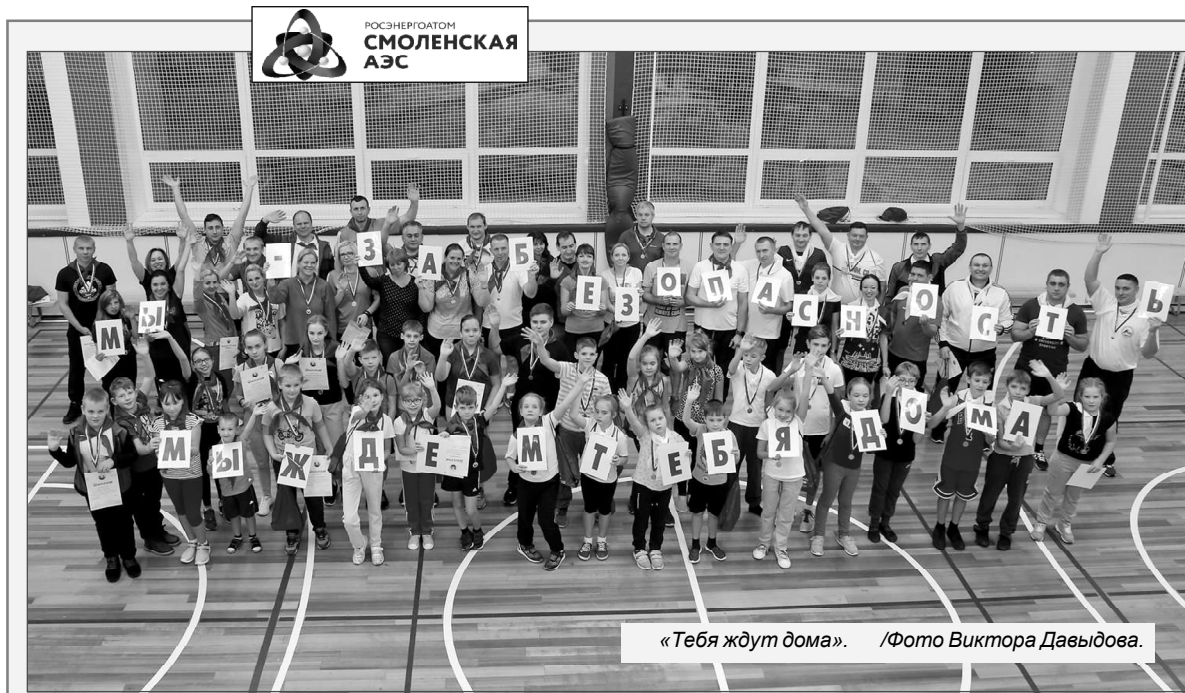
«Тебя ждут дома».

Управление информации и общественных связей Смоленской АЭС.