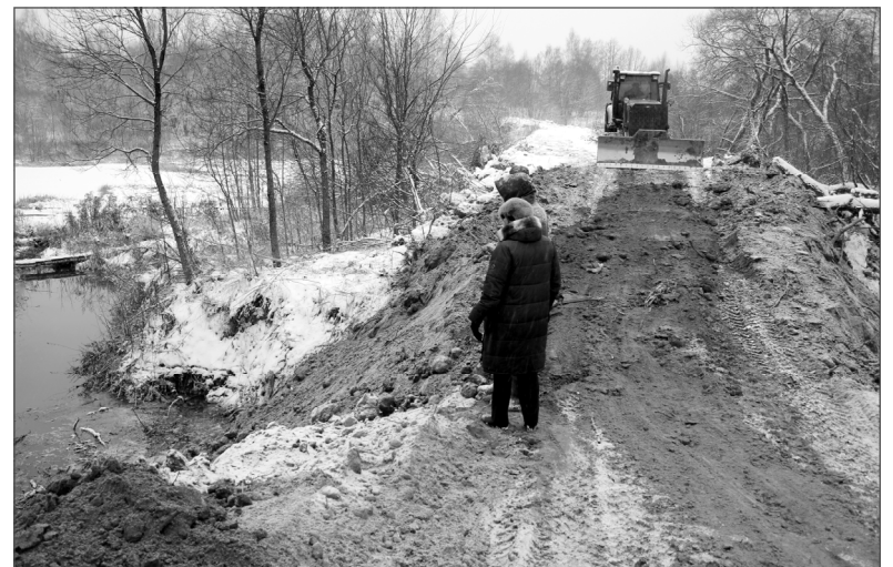
На снимках: объём выполненных работ впечатляет!