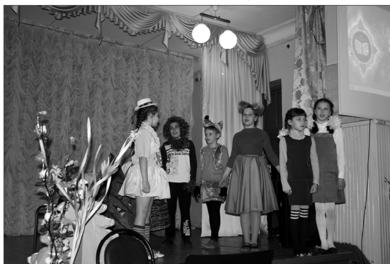
Небольшой концерт понравился всем присутствовавшим.