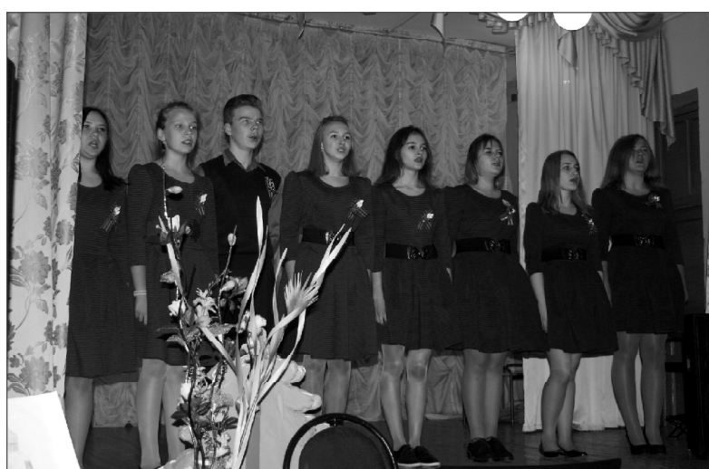
На сцене ансамбль «Жемчужина».