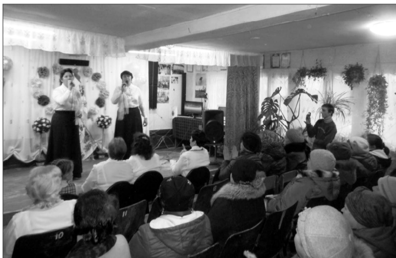
Зал в Павловском ДК всегда полон.