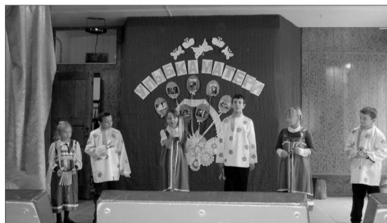
Много тёплых слов было сказано ребятами всем мамам.