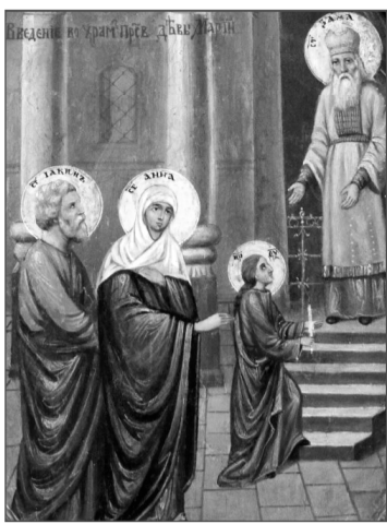
Введение во храм Пресвятой Владычицы нашей Богородицы и Приснодевы Марии празднуется Церковью как день всемирной радости.

Пресвятая Дева Мария родилась в небольшом Галилейском городе Назарете. Родителями Ее были праведные Иоаким, из рода пророка и царя Давида, и Анна, из рода первосвященника Аарона.