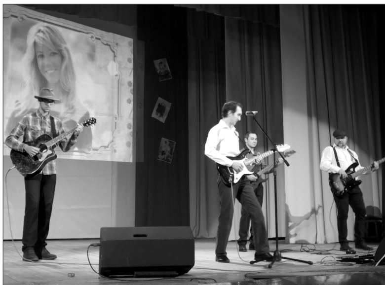
На сцене ВИА «Вирази времени».