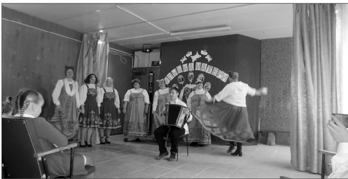
В Пронинском СДК порадовали своих земляков в этот праздничный день.