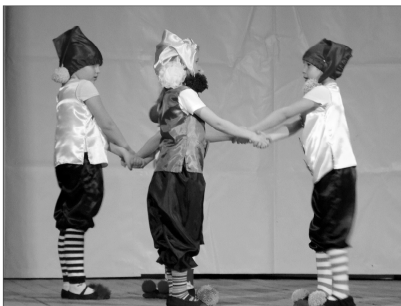
Смешные и трогательные Гномики (ансамбль «Грация») доставили зрителям много приятных минут.