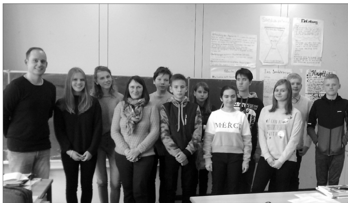
Снимок на память с немецкими друзьями.

Участники проекта посетили завод по переработке пластиковых бутылок в городе Дортмунде.