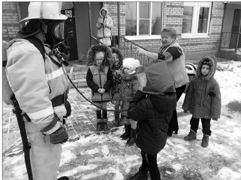
Ребятишкам всё было очень интересно.

Пожарные продемонстрировали ребятам спасательное устройство, которое позволяет эвакуировать по-