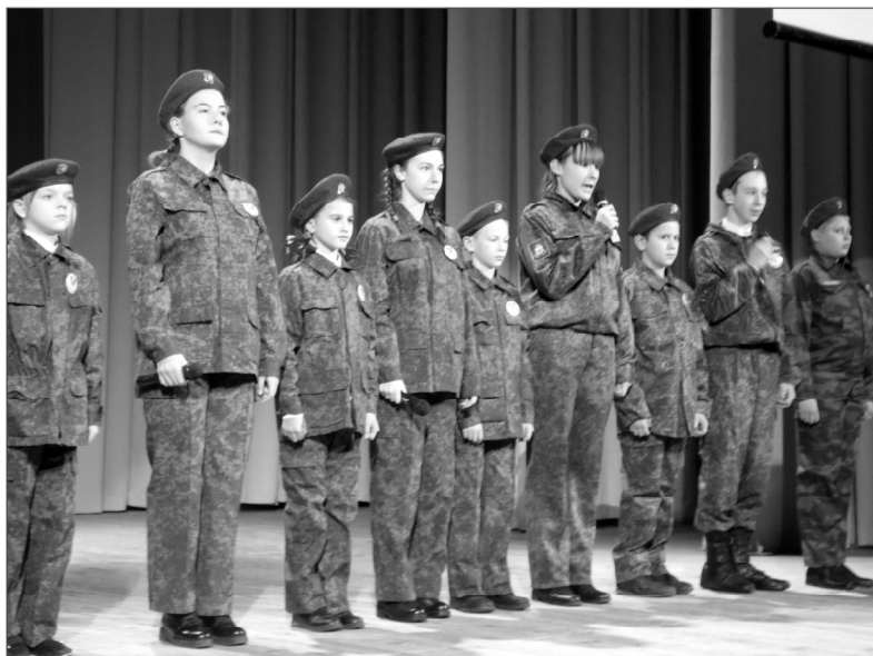
• Наши юнармейцы растут настоящими патриотами.