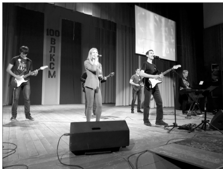
• Вокально-инструментальный ансамбль РДК и его солисты несли в зал задор и энергию юности.