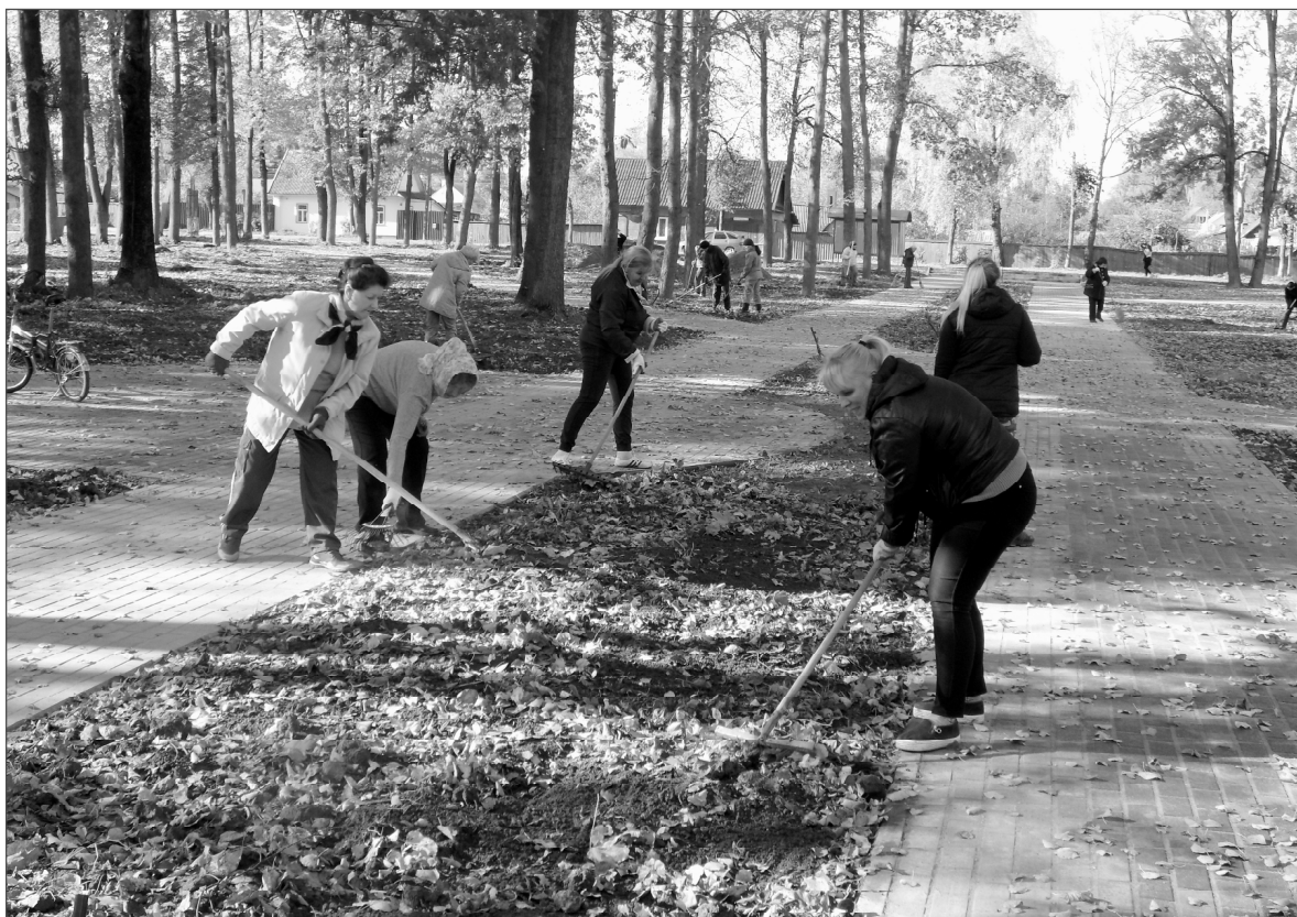
В такие моменты особенно остро ощущается единение.

На снимке: ельнинцы с энтузиазмом трудились на комсомольском субботнике.