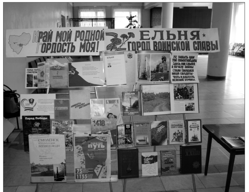
Книжная экспозиция, подготовленная районной библиотекой к этому патриотическому конкурсу.