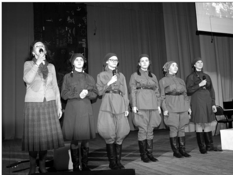
Команда-победительница из Десногорска.