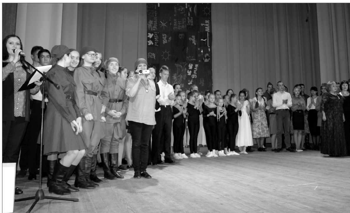
Участники фестиваля-конкурса «Праздник Красного Знамени». Снимок на память.

мецко-фашистских захватчиков, 77-летию рождения Советской Гвардии в боях под Ельней, Дню присвоения городу почётного звания «Город Воинской Славы» и 100-летию комсомола.