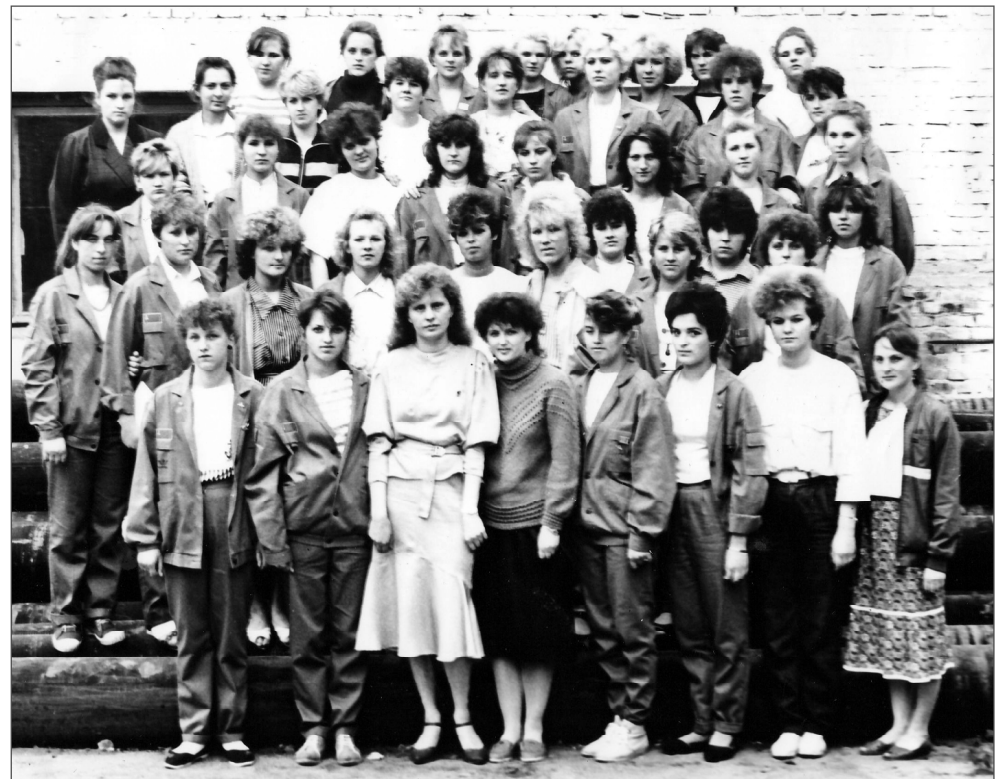
Студенческий отряд Ельнинского сельхозтехникума. 1990 год.