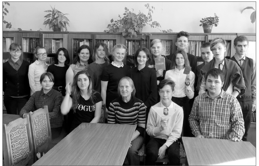
Участники устного журнала «Комсомольцы-добровольцы» в районной библиотеке.

И самое важное, когда ведущая журнала, поведав о простых, но одновременно и вели-