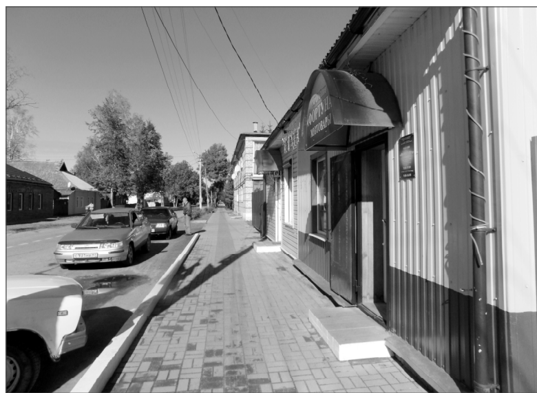
Современные удобные тротуары украшают Ельню.