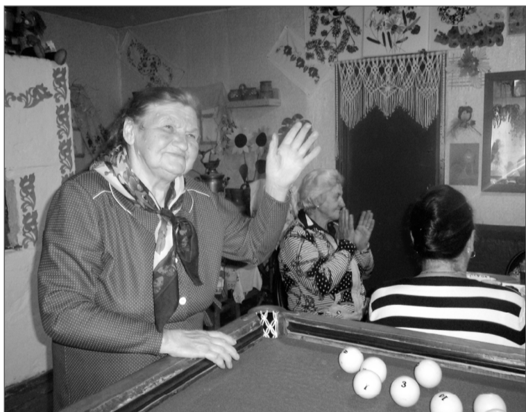
В этот день никто не скучал!