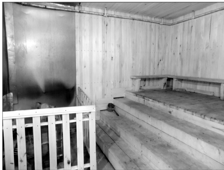
Долгожданная парилка теперь к услугам ельнинцев.