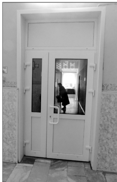
Новая дверь в библиотеке.