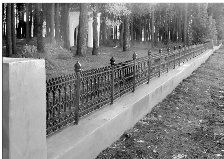
Словно помолодел сквер Боевой Славы с отреставрированной оградой.