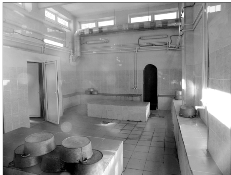
В моечном отделении бани.