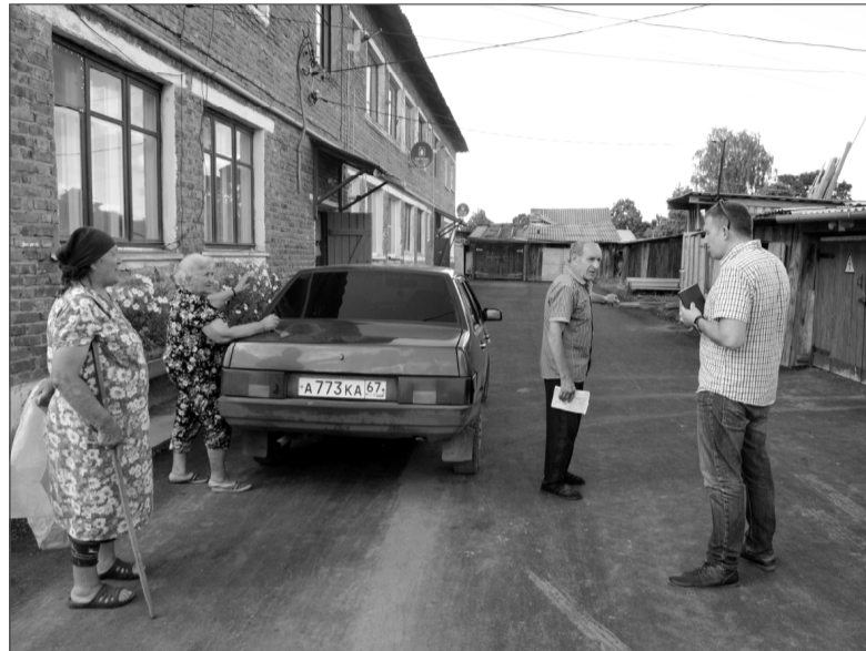
Двор дома № 16А по ул. Красноармейской.