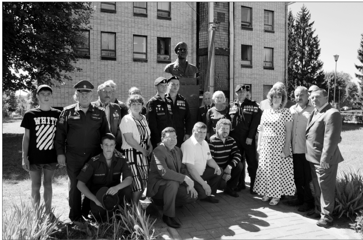
Снимок на память.