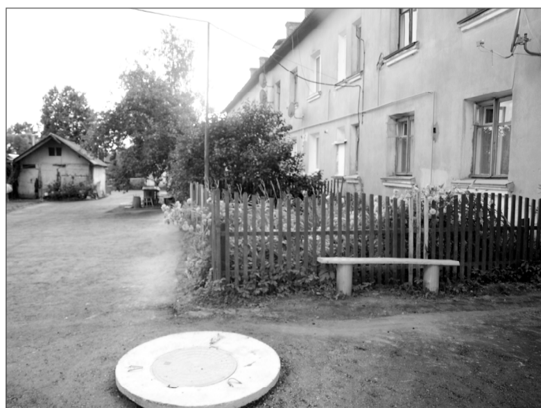
Дом № 19 по ул. Советской.

нибудь смогли. Дай Бог здоровья всем, кто помог нам в таком нужном деле.