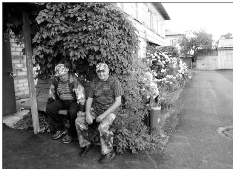
Улица Молодёжная, дом № 7.