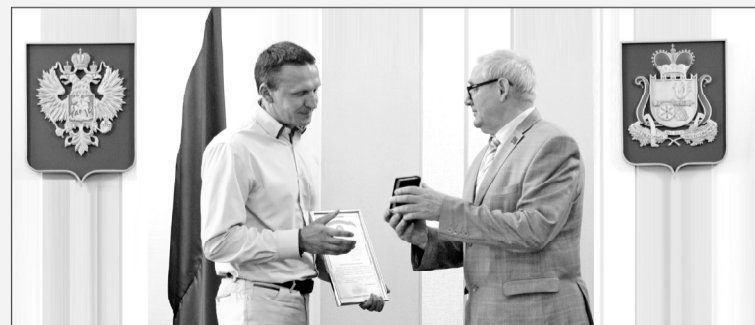
Церемония награждения в Администрации Смоленской области

Управление информации и общественных связей Смоленской АЭС.