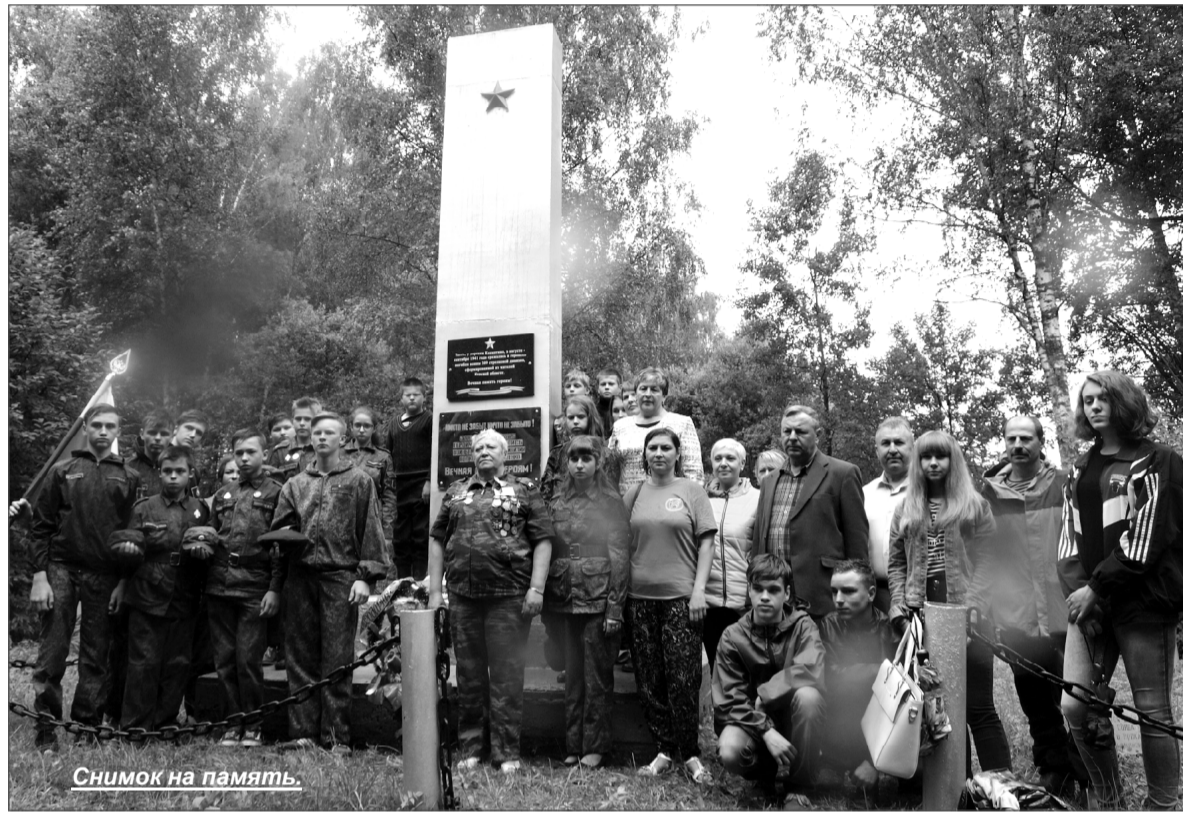
Снимок на память.

4 октября немецкая 11-я танковая дивизия заняла город Спас-Деменск, а пехотные дивизии вермахта к вечеру того же дня вышли к железной дороге Ельня — Спас-Деменск, полукругом войска 24-й армии с юго-востока. В это время 309-я, 103-я, 19-я, 139-я СД продолжали вести бои западнее Ельни,