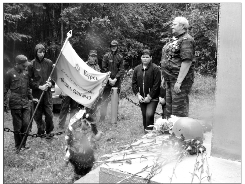
Учащимся надолго запомнится поездка на гвардейскую землю.

К полудню 7 октября противник окончательно занял Дорогобуж и Волочек, к вечеру повел наступление на Семлево с юга, выходя на большак Семлево—Вязьма. 309-я Курская сд пыталась