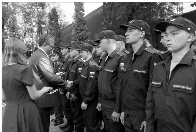
Часы новобранцам вручают заместитель Губернатора К.В.Никонов (на верхнем снимке) и военный комиссар области В.И.Рыкалов.

Настал черёд новобранцам охранять мир и покой России. Выступившие призывали учиться военному делу настоящим образом и вернуться домой профессиональными защитниками Великой Родины.