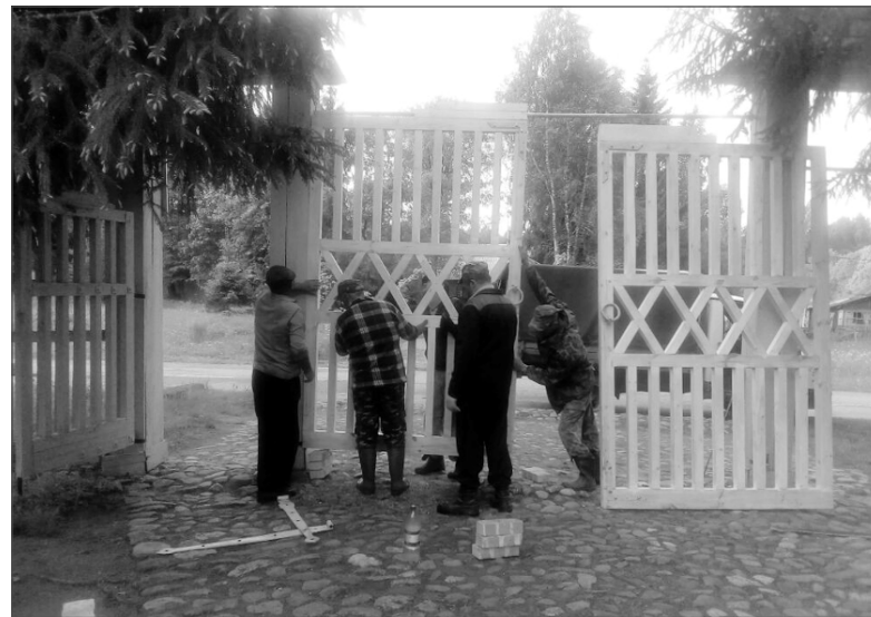
На снимке: установка новых ворот в Музей-усадьбе М.И.Глинки.