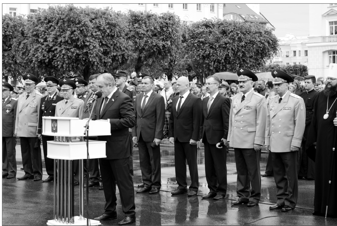
На снимке: Заместитель Председателя Госдумы РФ С.И.Неверов зачитывает поздравление Президента РФ В.В.Путина выпускникам академии.

От Патриарха Московского и Всея Руси Кирилла поздравление зачитал Митрополит Смоленский и Дорогобужский Исидор: «Убеждён,