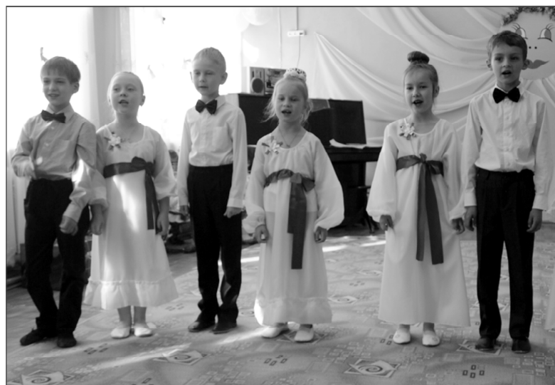
На снимках: неповторимая тёплая атмосфера царит на празднике в «Солнышке».