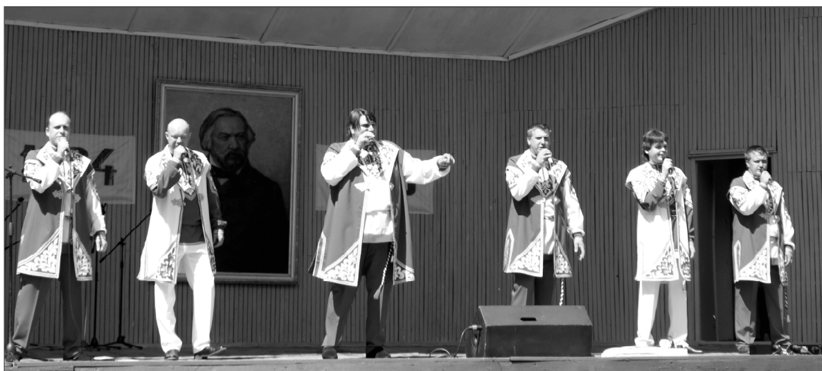
Ансамбль «Славянское братство» г. Починок.