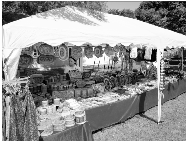
Яркие палатки с изделиями мастеров, звучащая музыка — всё создавало праздничное настроение.