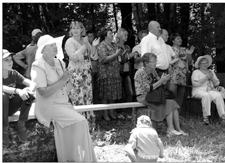
Истинные ценители музыки Глинки бывают здесь ежегодно.

* Более полный фоторепортаж можно посмотреть на сайте газеты http://zn-smol.ru , а также на сайтах «Одноклассники» и «ВКонтакте». Для этого стоит лишь набрать в поисковике: «Газета «Знамя» имени Михаила Исаковского».