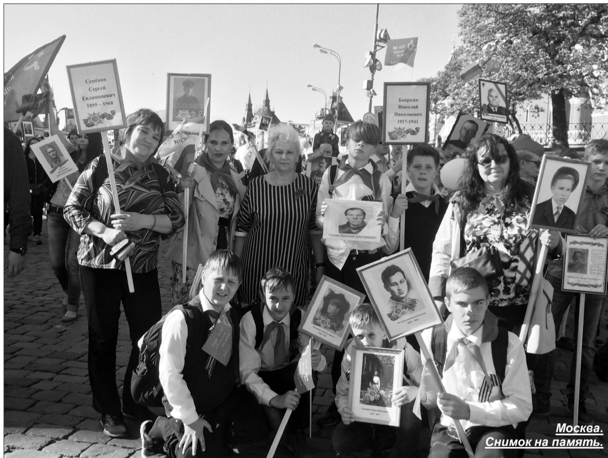
Москва. Снимок на память.