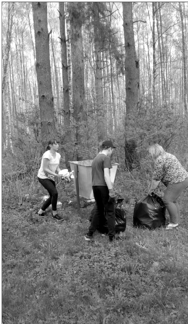
Мусора набралось немало.

* Материалы публикуются при финансовой поддержке Федерального агентства по печати и массовым коммуникациям.