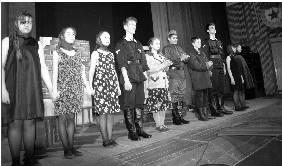
Растить патриотов: ко Дню защиты детей