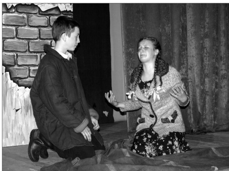
Сцена из спектакля.

Пауль: «У меня один страх остался. Я боюсь перестать бояться. Знаешь, я, когда увидел эту девочку (Саша – М.К.), бегущую по битым кирпичам через развалины, почему-то даже обрадовался. Вот