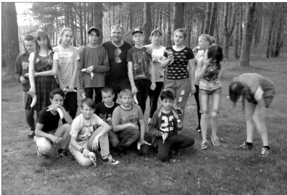
После трудов праведных бананы ребятам кажутся особенно вкусными.

Общими усилиями наши участники акции внесли свой вклад в уборку пляжной зоны Казаринки. Напомним,