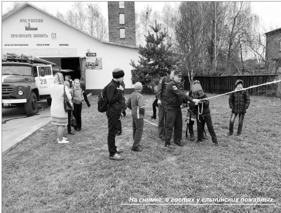
На снимке: в гостях у ельнинских пожарных.

кательной форме пропагандируют основы пожарной безопасности.