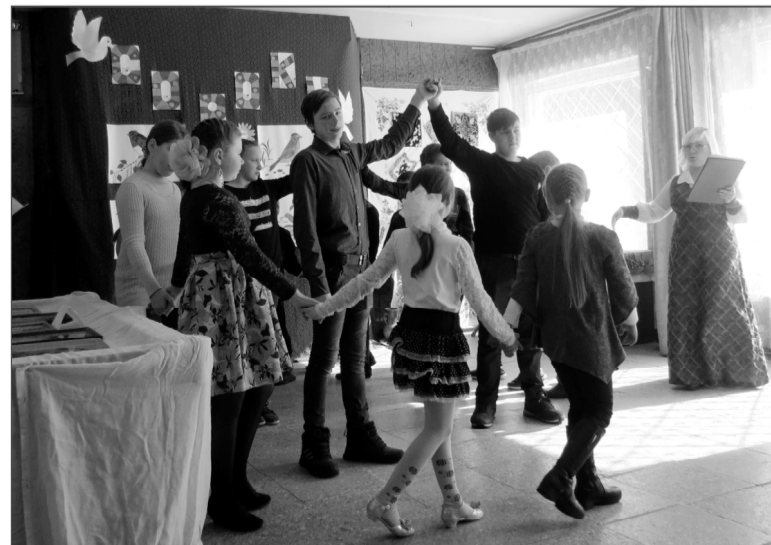
Детям по душе пришлась народная игра.

Еще раз поздравляем наше объединение с днем рождения и приглашаем к нам всех, кто любит музыку и литературу.