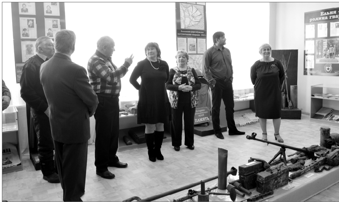
На снимке: в школьном музее.

Ученики Р.А.Халхатова провели десятки экскурсий, работали в лек-