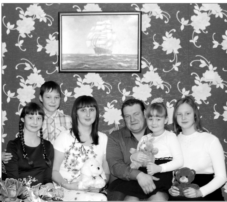
Семья Тимошенко.

– Мы с женой всегда хотели, чтобы в доме было весело и звенел детский смех, – говорит глава семьи. – В нашей семье так заведено, что мы всё делаем вместе, с любовью и уважением друг к другу. Ведь большая семья – это огромная радость – тебя всегда с нетерпением ждут дети. Если суждено, что у нас ещё родится ребёнок, а может быть и не один, то мы все будем только рады этому.