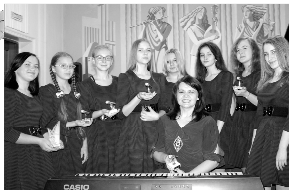
Наша «Жемчужина» – лауреат Международного конкурса!

Конкурсы проводятся с целью сохранения и развития традиций многонациональной культуры, выявления и всесторонней поддержки талантливых и перспективных детей, обмена творческим опытом представи-