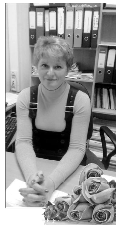
Из писем в редакцию