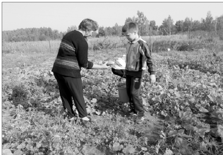
Пришкольный участок всегда ухожен, а в школьной столовой овощей в достатке.