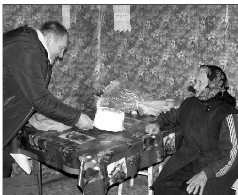
Хроника земли гвардейской